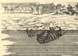
4. Primera toma de posición.