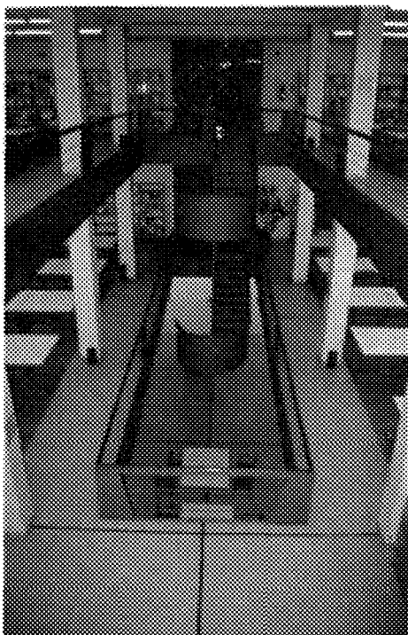
Vista interior de la Biblioteca "Gonzalo de Berceo"

de 500 m 2 , cuenta con casi 300 metros lineales de estantería y dispone de 160 puestos para el público. Su horario y días de apertura es idéntico a la Biblioteca "Gonzalo de Berceo".