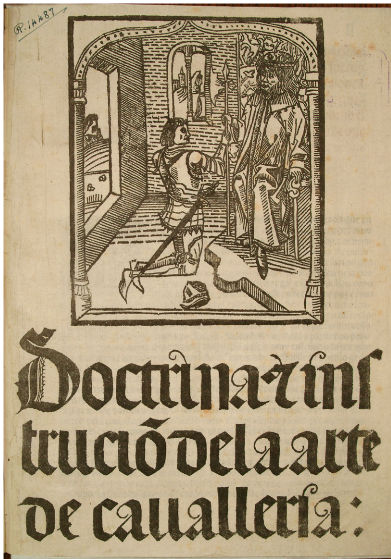
ILUSTRACIÓN N.º 1. Portada del Doctrinal de Caballeros , escrito hacia 1445 por Alonso de Cartagena y dedicado al conde de Castrojeriz.