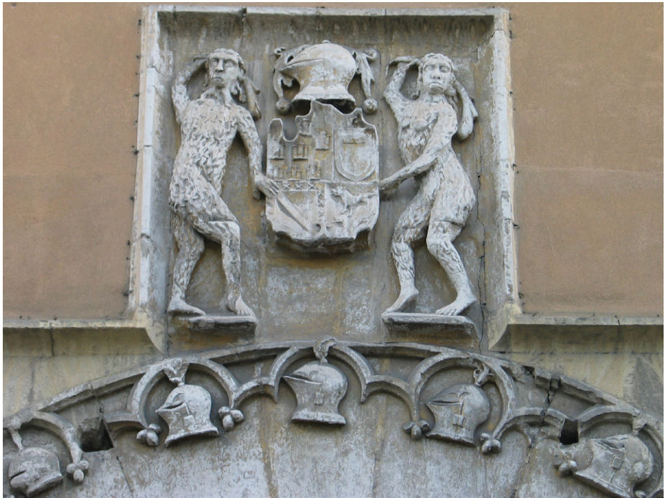
ILUSTRACIÓN N.º 2. Escudos en la portada del palacio Quintanar en Segovia.