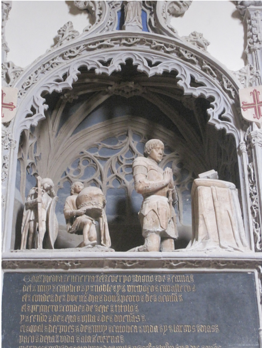
ILUSTRACIÓN N.º 4. Sepulcro de Pedro de Acuña en la Iglesia de Santa María de Dueñas (Palencia)