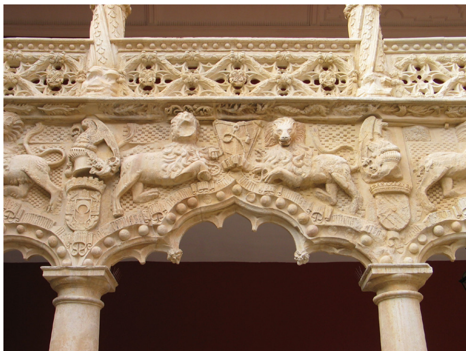
ILUSTRACIÓN N.º 3. Detalle de la inscripción que recorre el patio del Palacio del Infantado (Guadalajara)