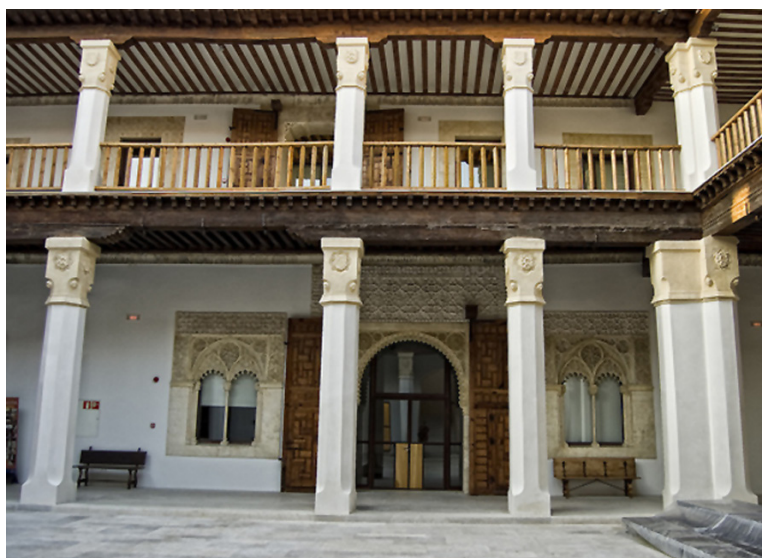
ILUSTRACIÓN N.º 6. Estado actual del Patio del Palacio de Fuensalida en Toledo.