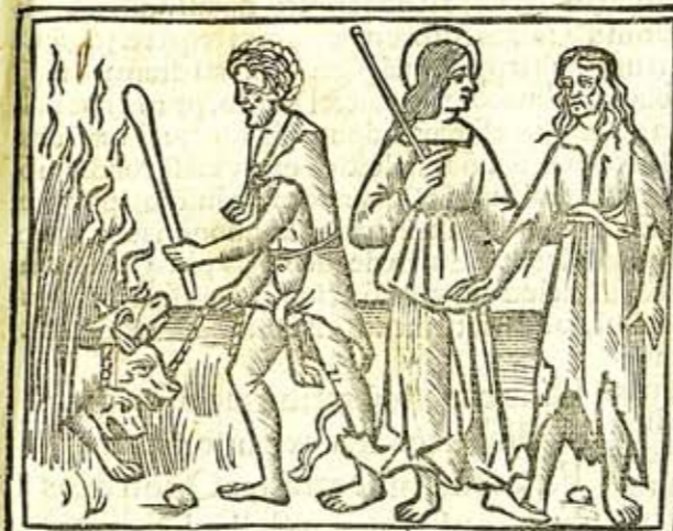
L. Annei Senec. Tragœdiae cū duob' cōmētis. Hercules furens tragœdia prima. Actus primus. Iuno loquitur.