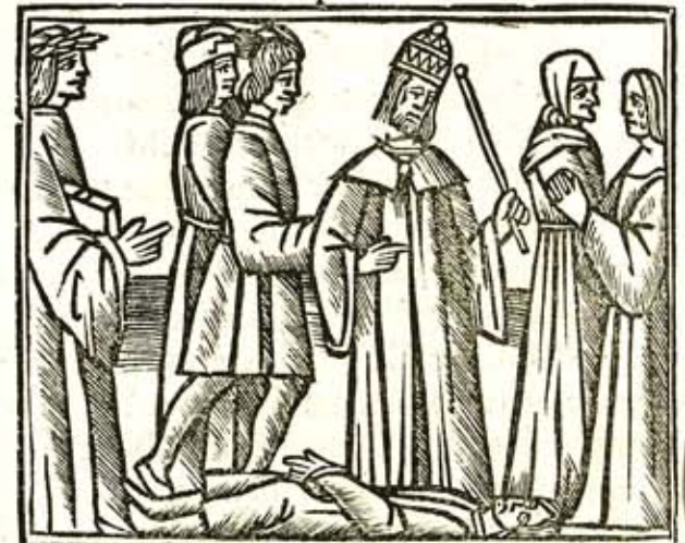
Incipit. viii. tragoedia q̄ Agamē. uocitat̄. Actus primus. Thyestes loquitur.

Sic fugere soleo: patuit in cœlum uia. Squamosa gemini colla serpentis iugo. Summissa præbent: recipe iam natos parens. Ego inter auras alato curru uehar. Ia. Per alta uade spatia sublimi ætheris: Testare nullos esse qua ueharis deos.