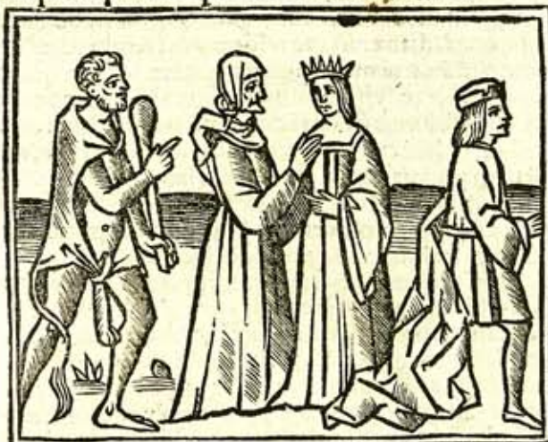
Quarta Tragœdia: q Hyppolitus inscribit. Actus primus. Hyppolitus loquitur.

Te umbrosas cingite siluas: Sūmaq; montis iuga cecropi: Celeri plāta lustrate uagi: Qui saxa solo carponeto. Subiecta iacēt: & q Thyasis Vallibus amnis rapida currēs