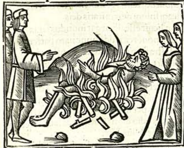
Tragœdia decima Incipit. Hercu. œteus. Actus primus. Hercules loquitur.

Ferus & manes ecce tyrannus. Quid iam frustra miseranda moror? Rapite ad lætum: quis ius in nos Fortuna dedit: testor superos: Quid agis demens: parce precari: Quis inuisa es numina diuum Tartara testor: herebiq; de os: Scelerum ultrices: & te genitor Dignum tali morte & pœna. Non inuisa est mors ista mihi Armata ratem. date uela fretis Ventisq; petat puppis rector Tandem phariæ littora terræ: Cho. Leues auræ zephiriq; leues Tectā quondam nube ætherea. Qui ue xistis raptam sæuā. Virginis aris iphigeniam Hanc quoq; tristi procul a pœna Portare precor templa ad triuiæ Urbe est nostra mitior aulis. Et maurorum barbara tellus. Hospitis illic cæde litatur Numen superum cuius gaudet roma cruore.