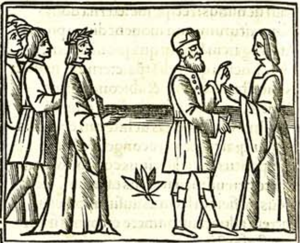
Incipit q̄nta tragœdia q̄ Oedipus uocitat̄. Actus primus. Oedi. Ioca. Oedi. loquit̄.

Am nocte pulsa dubius effulsi sit dies: Et nube mœstum squalida exoritur iubar Lumenq; flamma triste luctifera gerens. (domos) Iā cernet auida peste dsolatas