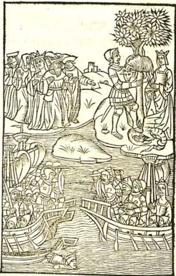
C. VALERII FLACCI SETINI BALBI ARGONAVTICON LIBER OCTAVVS.