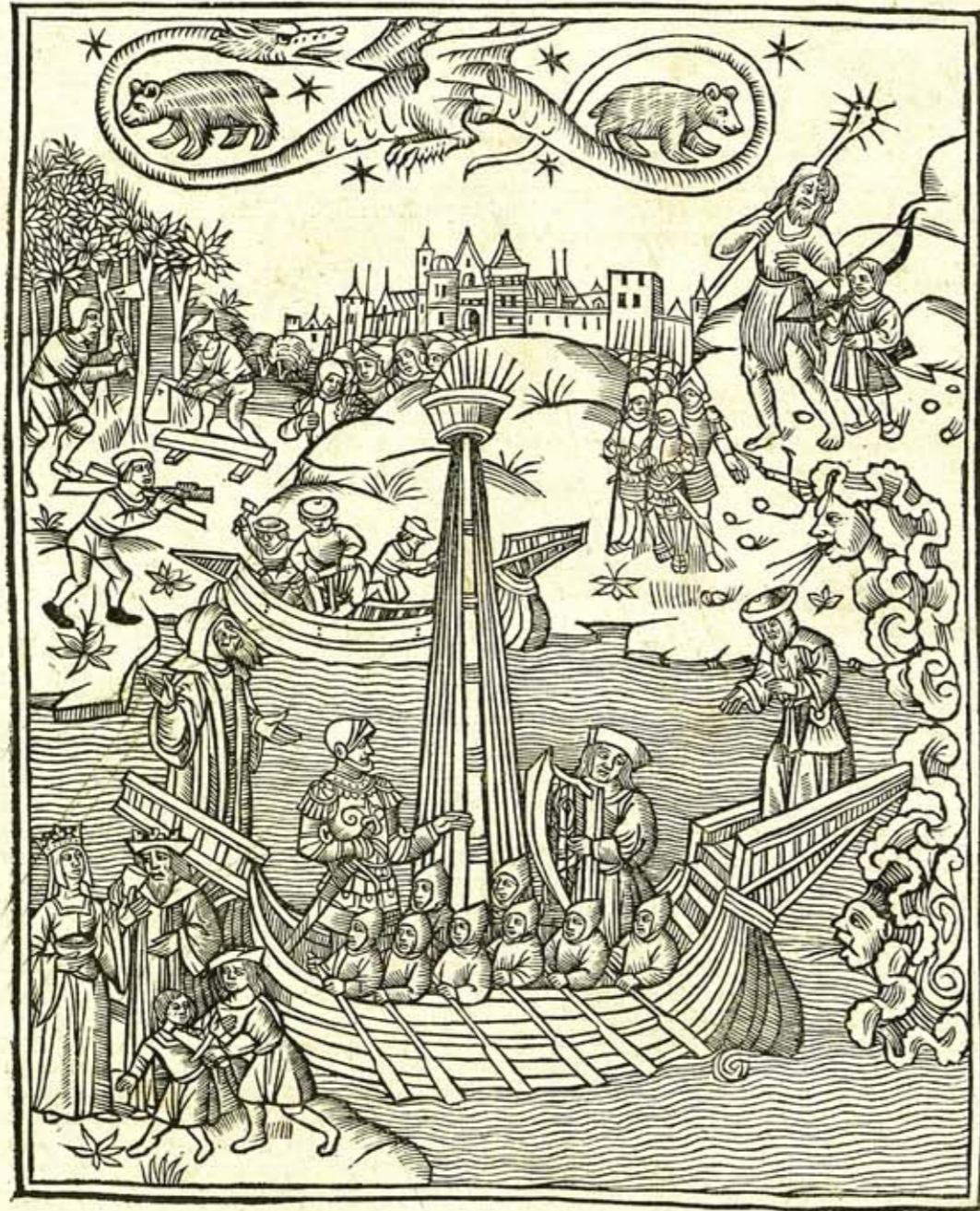
In primum Val. Flac. Librum Aegidij Maserij Argumentum.

agitem. Ignoscant queso & tacti bene precantur ijs, qui si non possunt (vt auris hispida iudicabit) saltē bene mereri de adulescentibus conantur. At non desistent canes putiduli oblatrantes. haud timeo: clauē nam vix feret vllus odorem Cerberus. Hanc si quis sentiat aufugiet.