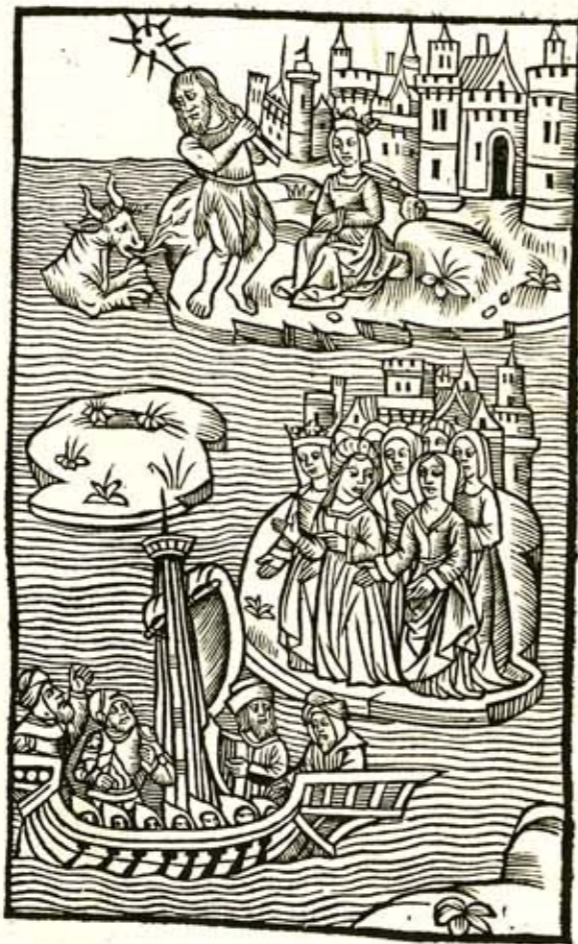
In secundum Val. Flac. librum Aeg. Maserij Argumentum.

dies amena. illic omnia sunt suo soli exposita nec nocti nec frigorib 9 obnoxia. Thyasi. saltationes, chori, & carmina. Virg. Pars pedib 9 plaudit choreas & carmina dicit. Patet. Cretheus. Tum porta. Cretheus ostendit quib 9 poenis torquendus sit Pelias. Porta sinistra. qua ingrediuntur impij: cuius limen sceleratum nulli fas cauto insistere. Virg. sinistram viam improborum ostendit. Et sub rupe sinistra Moenia lata videt triplici circumdata muro. Sed Pythagore sane litera dextram virtutis viam esse notat, sinistram vero voluptatis: quae latissima est, ad inferos deducens. Et dicitur Pythagorica litera a Pythagora exquisite interpretata verius q uam inuenta, q uod non omnibus placet. Inferos honores. apud inferos etiam virtuti locus est. Quin & homericus Vlyses putat Achillem ut inter viuos foelicem: ita inter vita caecos beatum & imperio potentem. licet respondeat Achil. se malle rusticum, mercenarium, seruum, mendicum, victusq ue egentem esse superstitem q uam mortuis imperare.