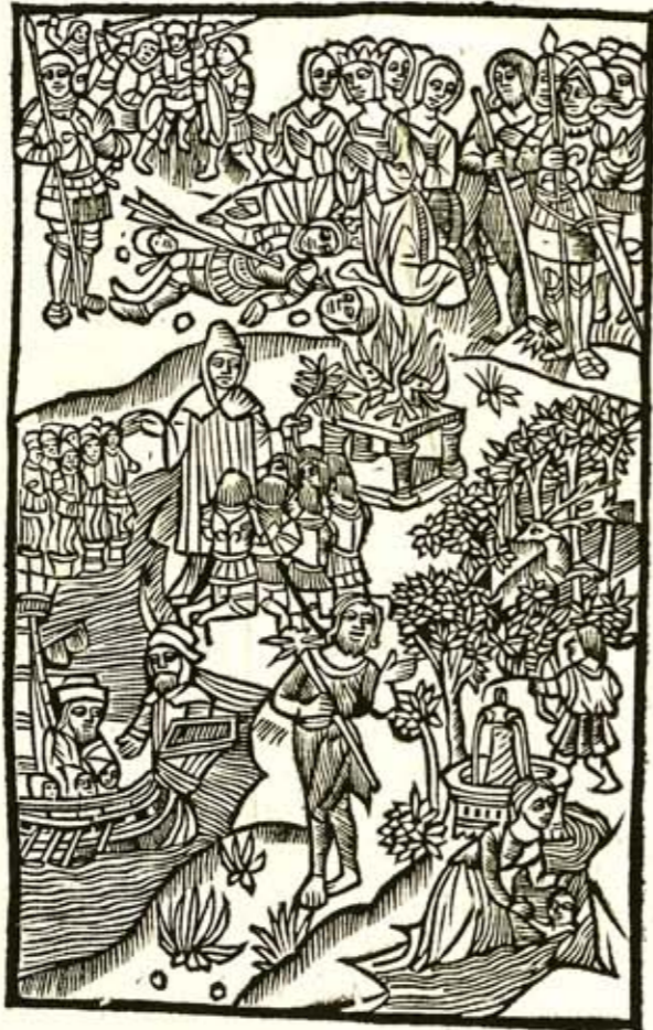
Aegidij Maserij in Tertium Val. Flacci Argumentum.

Cūctaq; se ratib 9 fundat man 9 : arma videbis Hospita: nec post hanc ultra tibi prēlia noctē, Sic ait, haecq; inter variis nox plurima dictis Rapta vices: nec nō simili lux postera tractu,