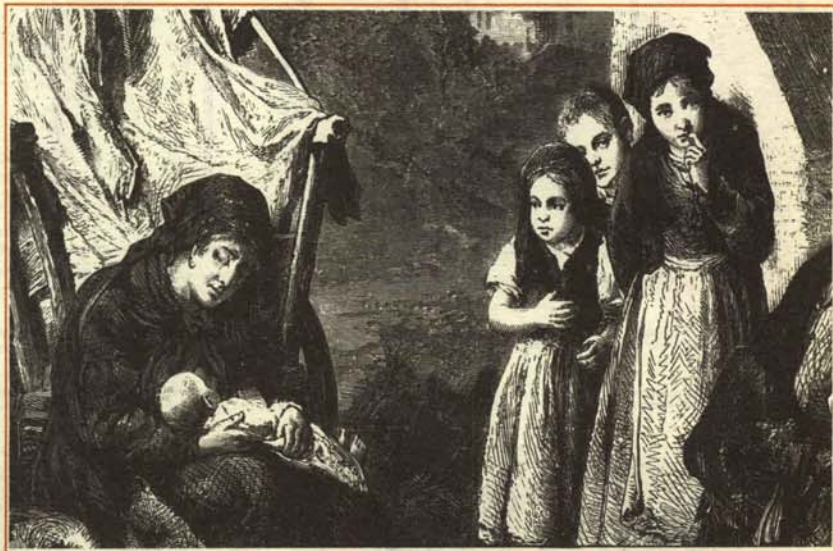
—No sobramos niños en el mundo. Lo que sobran son papás.