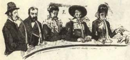
Respiradores públicos de oxígeno instalados en algunas ciudades contaminadas.

Parece que poco a poco se va venciendo el problema de la contaminación en las ubres de las grandes urbes. He aquí tres pruebas: