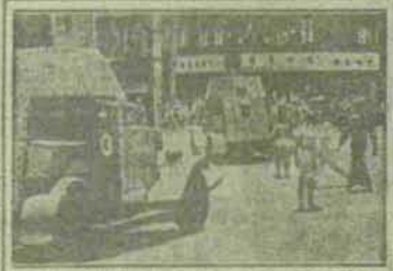
LOS RUSOS EN MANCHURIA

WASHINGTON, 10.—El Presidente Truman se dirigió por radio a las naciones de todo el mundo para anunciar la declaración de Potsdam. En su discurso, Truman anunció que los Estados Unidos, la Unión Soviética y Gran Bretaña habían acordado luchar contra el Japón antes de saber que existía la bomba atómica. También anunció que Polonia recibiría una sexta parte de Alemania Oriental y que los "cinco grandes" no tratarían de dar órdenes o dominar a otras naciones.