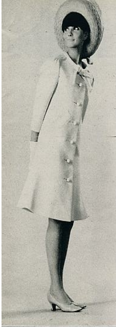
Abrigo «evasee» abotonado de arriba abajo. Un grueso bias remata el cuello con un nudo. Destaca la original montura de las mangas. CARDIN.