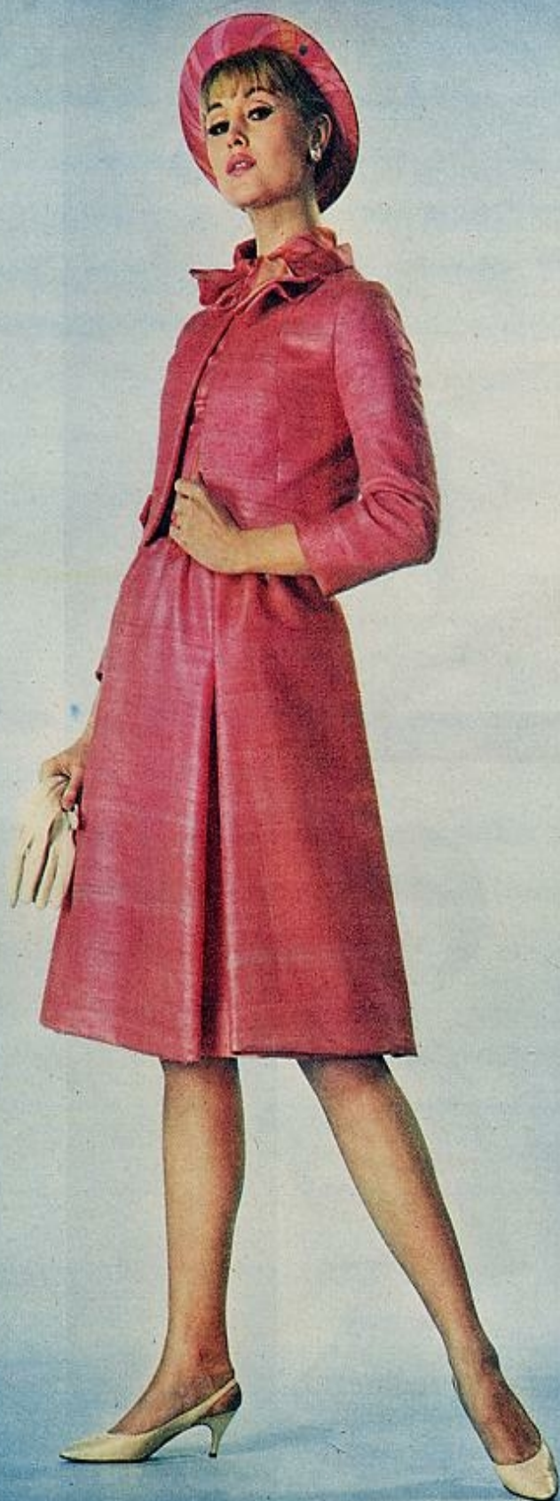
Vestido de shantung con cuatro pliegues profundos en la falda y cuerpo liso. Lo complementa una chaqueta corta, cerrada por un lazo. BALMAIN.