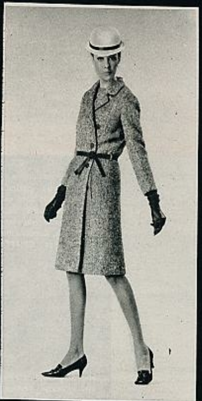
Conjunto de abrigo y vestido en espiga gris. El vestido, muy liso, no lleva mangas. El abrigo se ciñe con un cinturón de cuerpo negro. DIOR