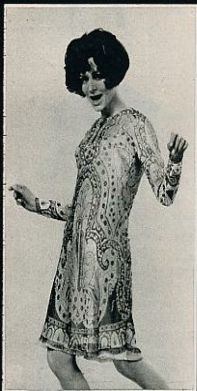
Vestido de cóctel en muselina estampada con dibujos «cachimbre» negro y blanco. La falda, muy corta, termina en un fleco negro. FERAUD.