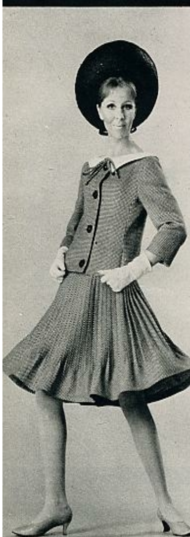
Plisado «soleil» y borde planchado en la falda de este dos piezas. Los pliegues están cosidos en las caderas. Cuello blanco almidonado. CARDIN.