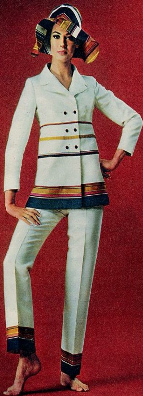
Dos piezas de playa en hilo blanco, con franjas irregulares en rojo y azul. Línea levita en la chaqueta, que cierra con diminutos botones. FERAUD.