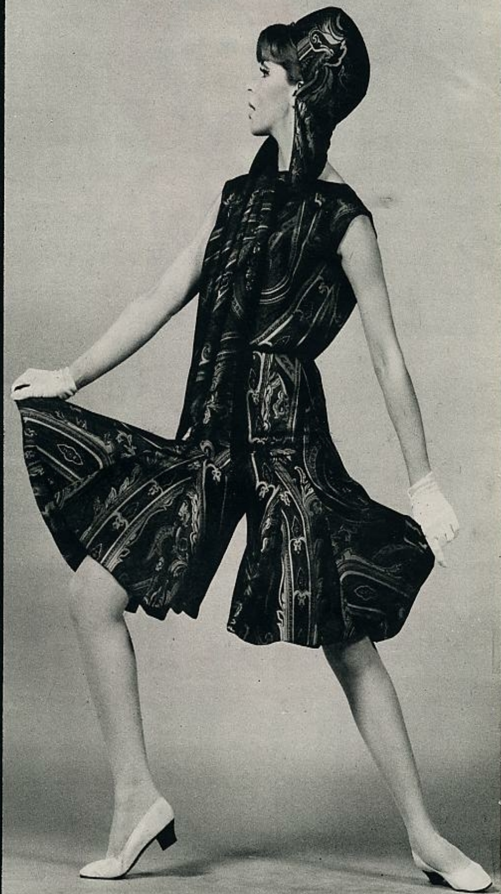
La tímida propensión del año anterior a incorporar el pantalón se afirma esta temporada. Un vestido-pantalón, realizado en seda natural estampada. Amplios egodetsu hacen que la falda disimule su artificio. JACQUES HEIM.