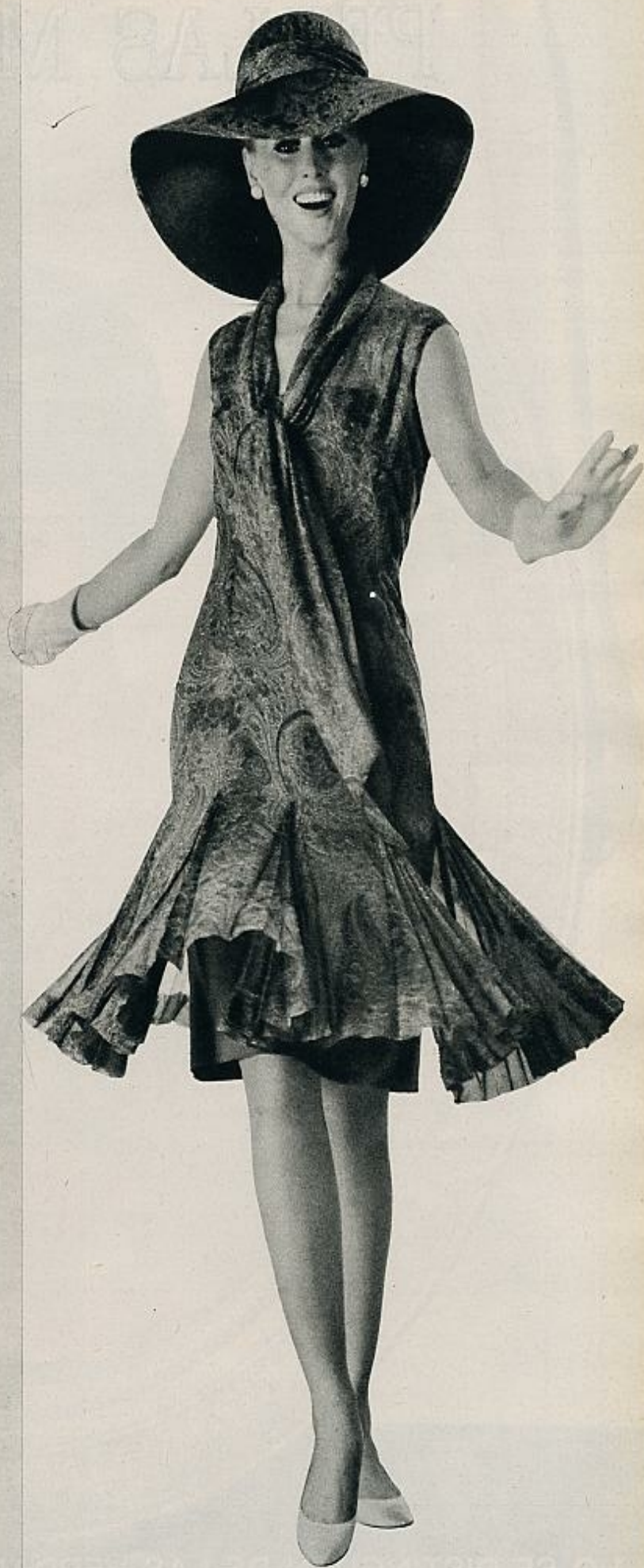
Organza estampada en tonos de verde. La falda se abre en el bajo en finos pliegues «soleil». Larga corbata, que anuda en el escote. GRIFFE.