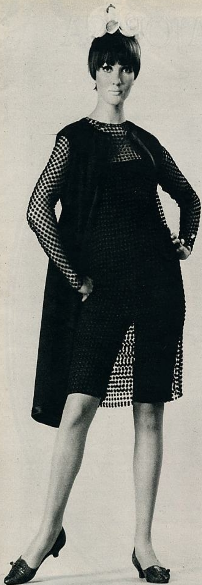
Vestido-pantalón recubierto por una túnica de encaje, con mangas largas y abotonada en la espalda, y abrigo sin mangas bordeado de raso. REIM.