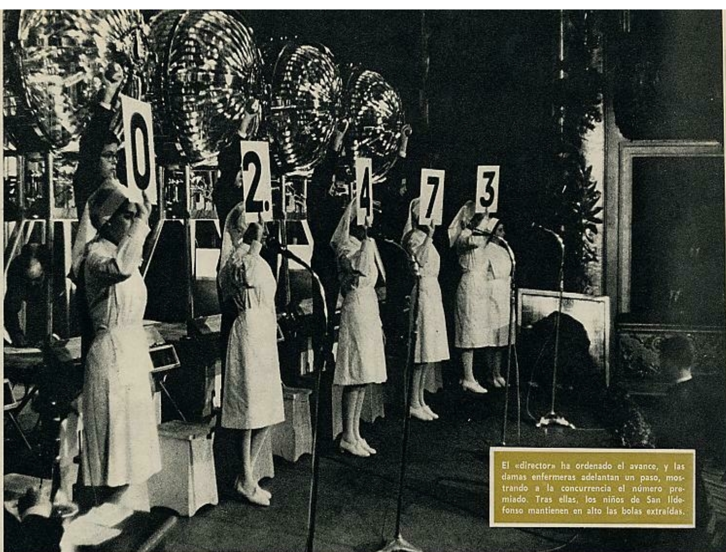
El «director» ha ordenado el avance, y las damas enfermeras adelantan un paso, mostrando a la concurrencia el número premiado. Tras ellas, los niños de San Ildefonso mantienen en alto las bolas extraídas.

L A institución creada por el rey Carlos III para nutrir las muy exhaustas arcas del Tesoro, soporta hoy el excesivo peso de sus casi dos siglos de edad, y siente, en consecuencia, la necesidad de renovarse, ponerse a tono con los tiempos, aligerar un poco sus entumecidas estructuras.