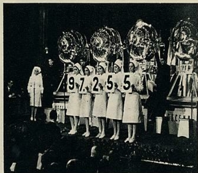
El «gordo», en el nuevo sistema, es el último en salir. Una vez cantado, las damas enfermeras se adelantan —única vez durante el sorteo—, avanzan un paso más y se juntan, mostrando al público las cinco cifras unidas.