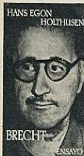
HANS EGON HOLTHUSEN BRECHT ENSAYO

Muchos países han solicitado ya conexión por radio y Eurovisión. Barcelona será, dentro de unas semanas, escenario de la quinta edición del Festival Mediterráneo, uno de los certámenes de la canción más importantes del mundo.