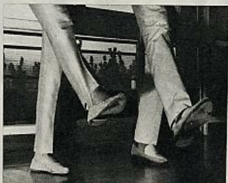
5 El izquierdo se cruza y baja por detrás permaneciendo sobre la planta, mientras el derecho se lanza hacia adelante.