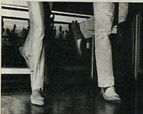
4 El pie izquierdo se lanza hacia atrás impulsando el cuerpo hacia adelante.