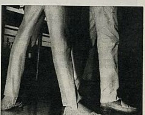
3 Avanza el derecho un largo paso.