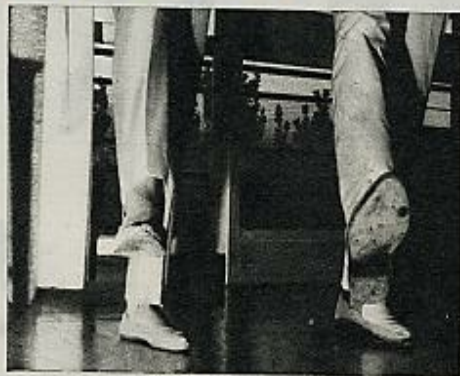
2 Pie derecho extendido hacia adelante. Pie izquierdo sobre la planta.