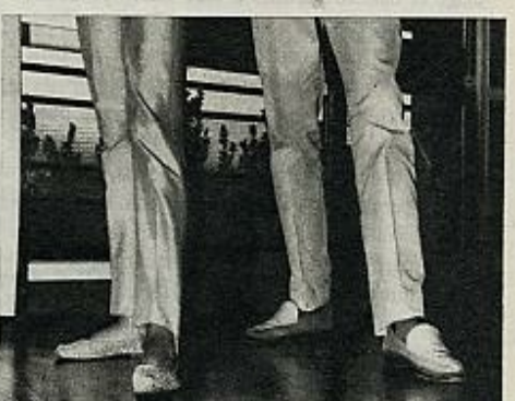
6 Nuevo retroceso iniciado por el pie derecho y a continuación el izquierdo. Y se vuelve a la posición foto n.º 1.