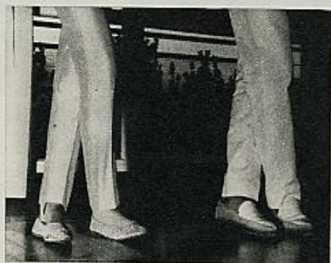
3 Baja el pie derecho hasta cruzarse con el izquierdo, que permanece en su posición.