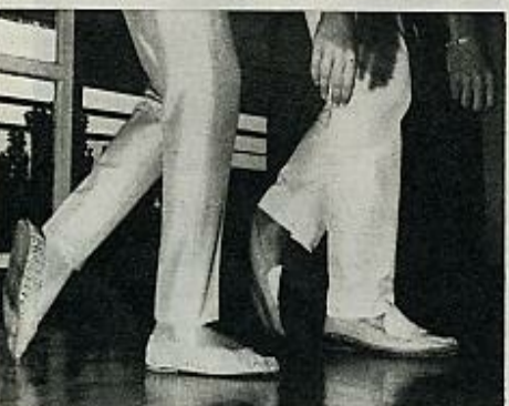
4 El izquierdo alcanza al derecho apoyándose sobre la puntera.