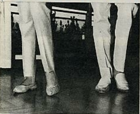
1 Posición primera del Paso de Apertura.