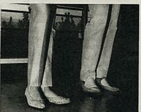
5 Retrocede el derecho e inmediatamente el izquierdo, quedando juntos sobre la planta.