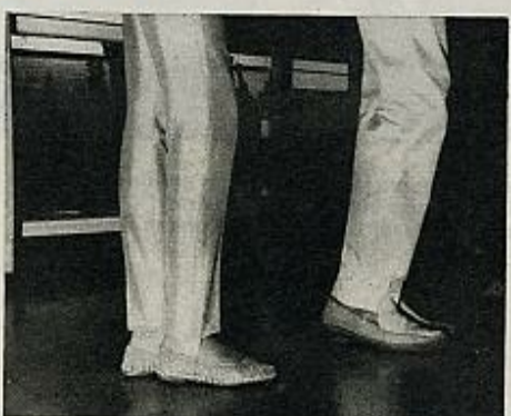
2 El pie derecho junto al izquierdo y permanecen ambos sobre la planta.