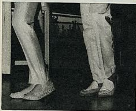
1 Posición inicial del Paso de Apertura o Paso Normal del Madison.