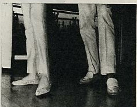
6 El derecho retrocede hasta quedar detrás del izquierdo y ambos se apoyan sobre la planta. Y se vuelve a la posición foto n.º 1.