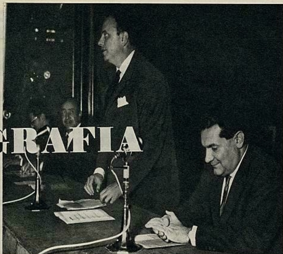
Primero habló Sáenz de Meredia, director de la Escuela; luego, García Escudero, Director General de Cinematografía, y, finalmente, el Ministro de Información, señor Fraga Iribarne, a quien vemos entre los citados.

rector General de Cine y al Ministro de Información. Era ésta la primera vez que ambos iban a abordar públicamente el siempre delicado tema del cine español. La primera ocasión solemne en que iban a apuntarse unas directrices con respecto a determinados problemas. Porque, aunque allí iba a hablar-