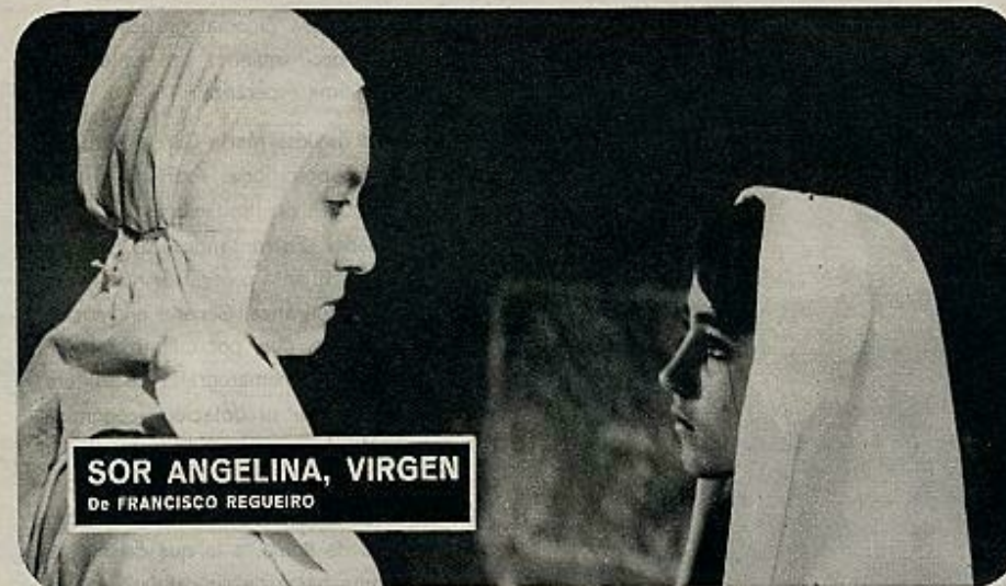
SOR ANGELINA, VIRGEN De FRANCISCO REGUEIRO

Una taberna de suburbio. Vino y, en el aparato de radio, el diario hablado de Radio Nacional. Un borracho alborota a los parroquianos. Avisan a un amigo suyo, que acude a la taberna. Le convence y se lo lleva a casa. El borracho devuelve. Se acuesta, mientras la dueña de la casa reprocha a su marido por ayudar al amigo. Nos enteramos de que ha pasado varios años en la cárcel. A la mañana siguiente, cuando el matrimonio se levanta, el borracho se ha ido sin dejar rastro. El marido se marcha a su trabajo.