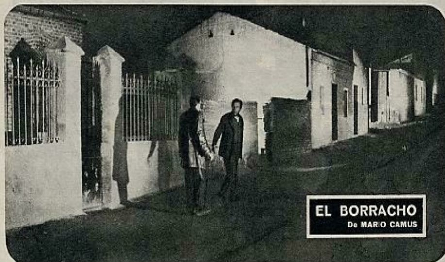
EL BORRACHO De MARIO CAMUS