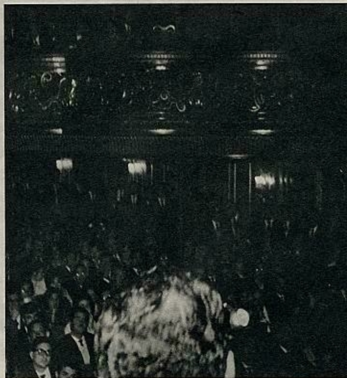
El señor Fraga Iribarne se dirige al público —todo el cine español— que

Esta vez, la inauguración de curso tuvo especial interés. Así lo refleja el lleno absoluto del Palacio de la Música, donde «todo el cine español» acudió a ver las películas de Mario Camus, Francisco Regueiro, Antonio Mercero y Manuel López Yubero y, muy especialmente, a escuchar al Di-