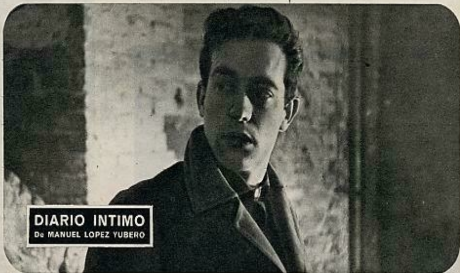
DIARIO INTIMO De MANUEL LOPEZ YUBERO

Película de gags, confiados a un hábil y armónico desarrollo de la imagen y la banda sonora. Un tonto correte por las calles de Madrid. Un conferenciante se queda sin pronunciar palabra: se lo impide una serie de cómicas incidencias. Un soldado practica el desfile militar en una academia de baile. Película sin argumento, cuya eficacia está en el gag y en un humorismo bondadoso y amable. Muchos de los gags fueron aplaudidos por los espectadores.