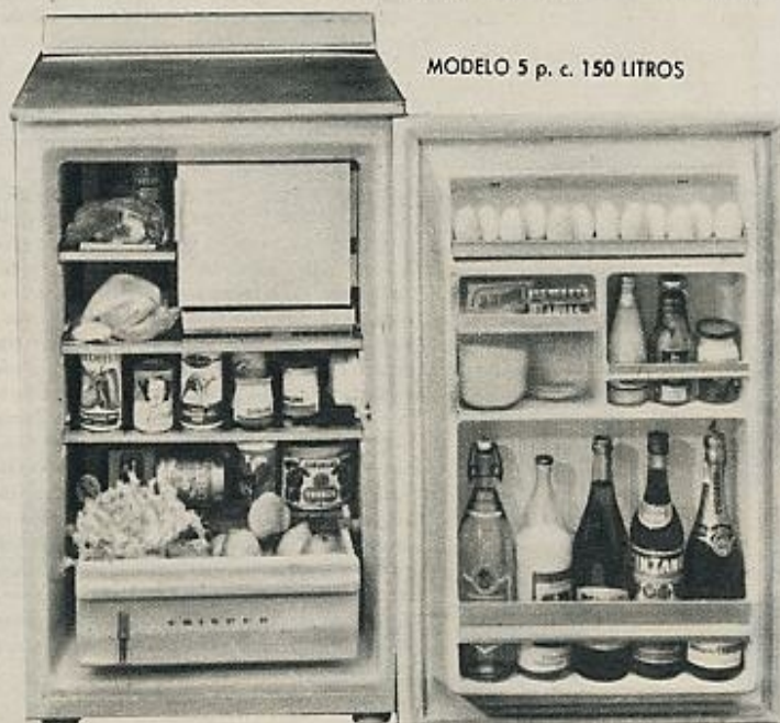
MODELO 5 p. c. 150 LITROS

La red de servicio técnico de atención y garantía KELVINATOR es un aval más de su calidad y prestigio internacional que le permite ofrecer al usuario: