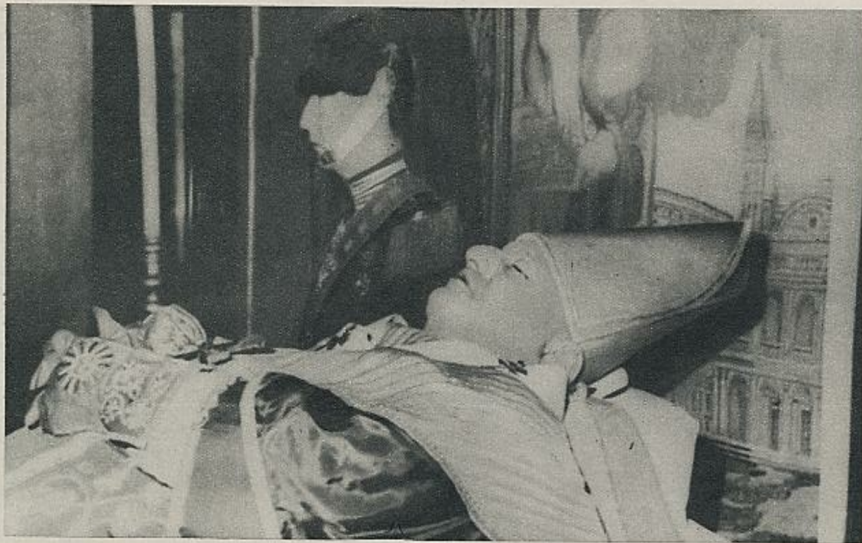
El cuerpo de Juan XXIII, en el salón contiguo a la habitación donde falleció. Un semblante sereno, una expresión de paz, como el esbozo de una sonrisa en su rostro. Parece imposible que el Papa haya muerto. Horas después, cuando el cadáver era trasladado a la Basílica de San Pedro, millones de personas veían esa misma expresión a través de las imágenes televisadas. También por la televisión parecía que el Santo Padre estaba durmiendo y que de pronto habían desaparecido de su cara las huellas del terrible y prolongado sufrimiento final.