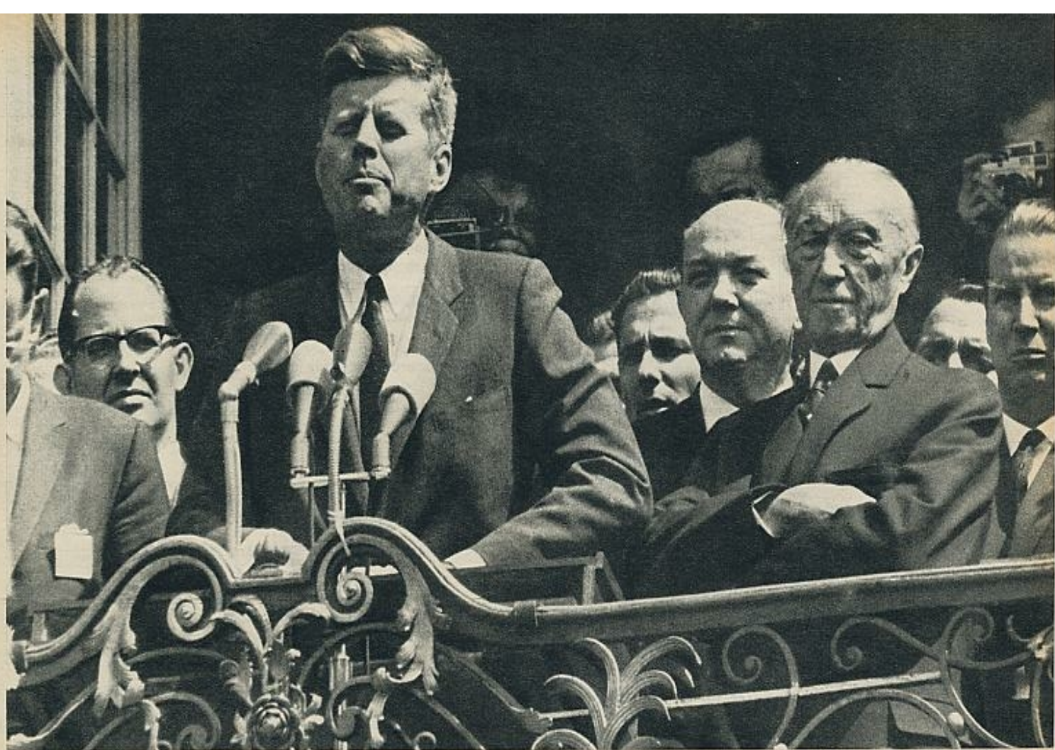
Kennedy en Colonia, donde pronunció un discurso ante una gran muchedumbre. Se dice que su viaje a Europa lo emprendió desoyendo los consejos de sus expertos.

es que ahora están realmente amenazadas las ciudades de Estados Unidos. Los Estados Unidos han podido intervenir en las dos últimas grandes guerras con la seguridad de que su territorio permanecería siempre alejado de los frentes de combate. (La única guerra que haya soportado hasta ahora el país en su territorio fue una guerra civil, la guerra de Secesión por la esclavitud o la libertad de los negros: la hicieron tan mal que no ha terminado todavía.) Por eso el diablillo zumbón del escepticismo, que es europeo, entiende mal estas frases de ahora. No acaba de ver claramente por qué los Estados Unidos se interesan ahora tan profundamente por las ciudades que hace tres años destruían y por los naranjales que arrasaban. Interprete que lo que Kennedy quiere decir a los alemanes es «Arriesgad vuestras ciudades para ayudarnos a salvar las nuestras» o «No os importe el sacrificio de la Acrópolis y de los naranjales si a cambio tenemos submarinos atómicos en el Mediterráneo».