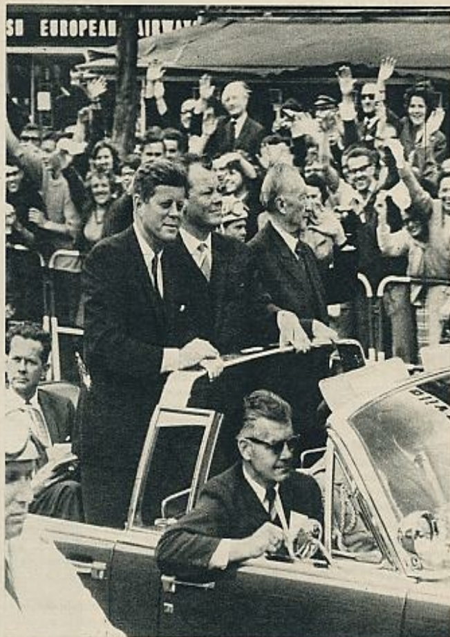
Kennedy en Berlín. Gran número de observadores políticos europeos opinan que los discursos pronunciados por el Presidente, estuvieron destinados a crear una cohesión en torno suyo. En la foto, con Kennedy, Adenauer y Willy Brandt.

A RRIESGAREMOS nuestras ciudades para defender las vuestras, ha dicho Kennedy a los alemanes —y, de una manera general, a los europeos que le quieran escuchar—. La frase es hermosa, sonora y antigua. Al mismo tiempo, el Departamento de Estado hacía pública una nota asegurando que los submarinos nucleares norteamericanos del Mediterráneo habían sido enviados para proteger «la Acrópolis y los naranjales italianos». Los Estados Unidos tienen costumbre de estas operaciones defensivas, aunque hayan demostrado un interés contradictorio por las ciudades alemanas y los naranjales italianos. Hace unos cuantos lustros destruían sistemáticamente las ciudades alemanas para defender las ciudades rusas. Yo estuve en Francfort algún tiempo después del bombardeo ordenado por Eisenhower y soy testigo de la eficacia con que cumplieron su trabajo de defensa. Los naranjales italianos, por su parte, tuvieron por aquellas fechas contacto directo con las divisiones blindadas americanas que los defendían de los alemanes. La diferencia de la situación de entonces con respecto a la de ahora