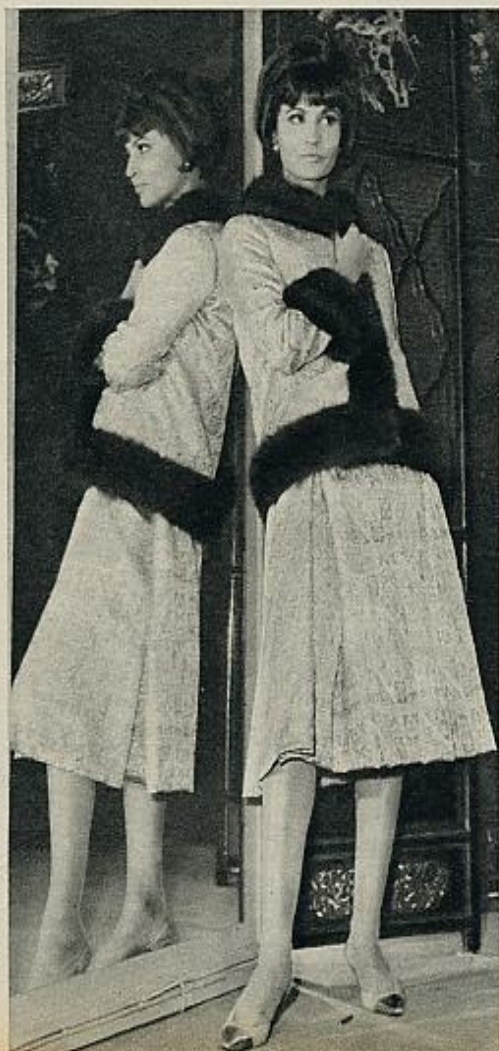
En un grueso y espectacular lamé está realizado este dos piezas para noche, con la chaqueta enteramente ribeteada de piel oscura.