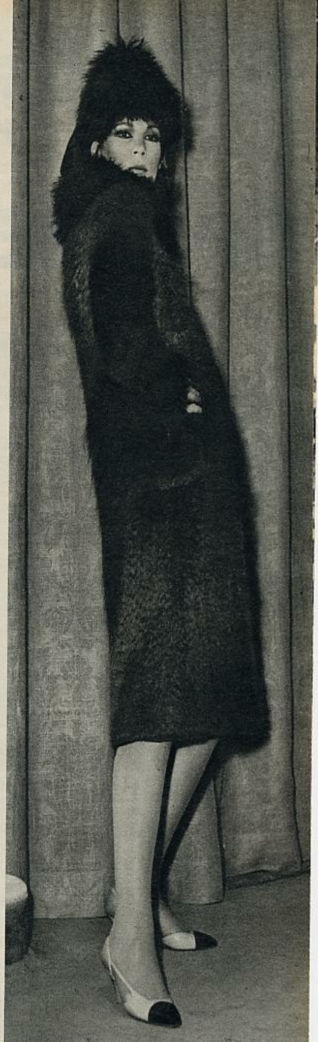
La calidad de la lana y la piel que bordea cuello y puños hacen innecesario cualquier adorno y posibilitan la simplicidad de líneas de este abrigo.