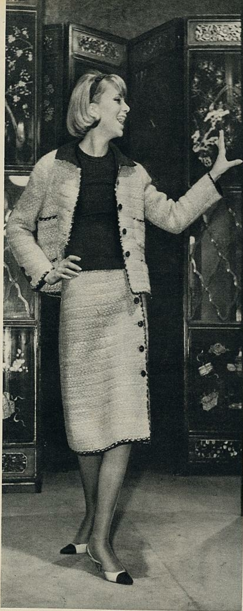
Los trajes de chaqueta han sido, desde siempre, la especialidad de Chanel. Siempre acompañados de blusa y realizados en «tweeds» que crea la misma modista.