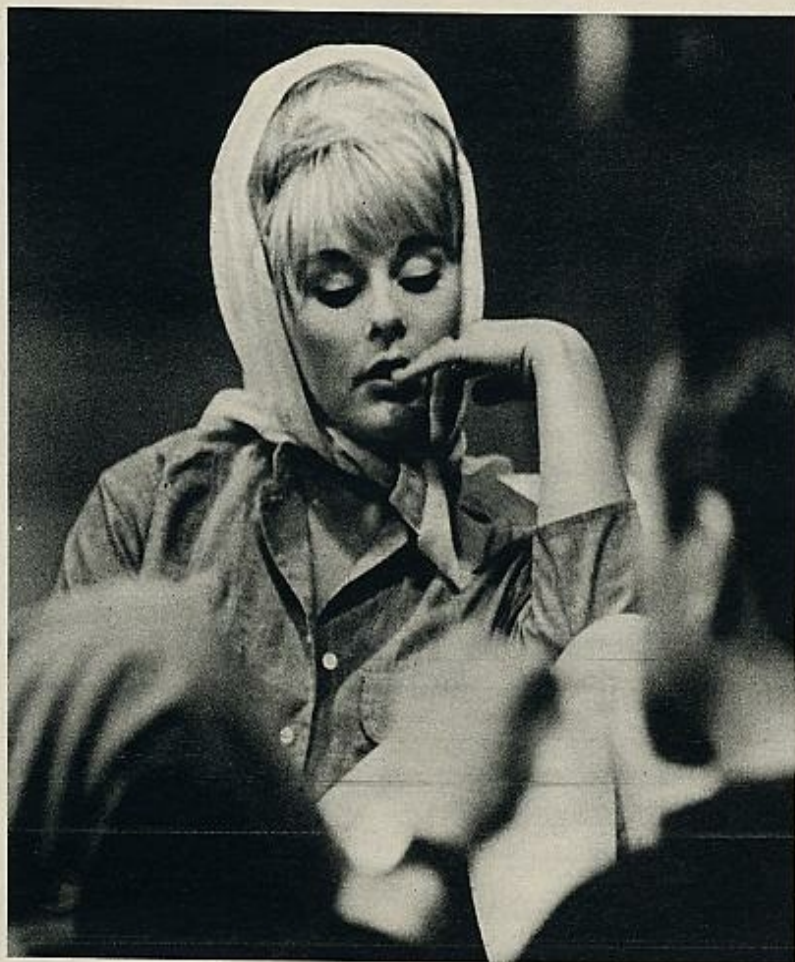
En la primera película de esta nueva fase de su carrera cinematográfica, Elke Sommer trabaja junto a Paul Newman. «El premio» —arriba, una escena del film— es la adaptación de un «best-seller» cuya trama gira en torno a los galardones literarios. La Sommer no podía imaginar, hace un par de años, que los expertos de Hollywood habían puesto sus ojos en ella.