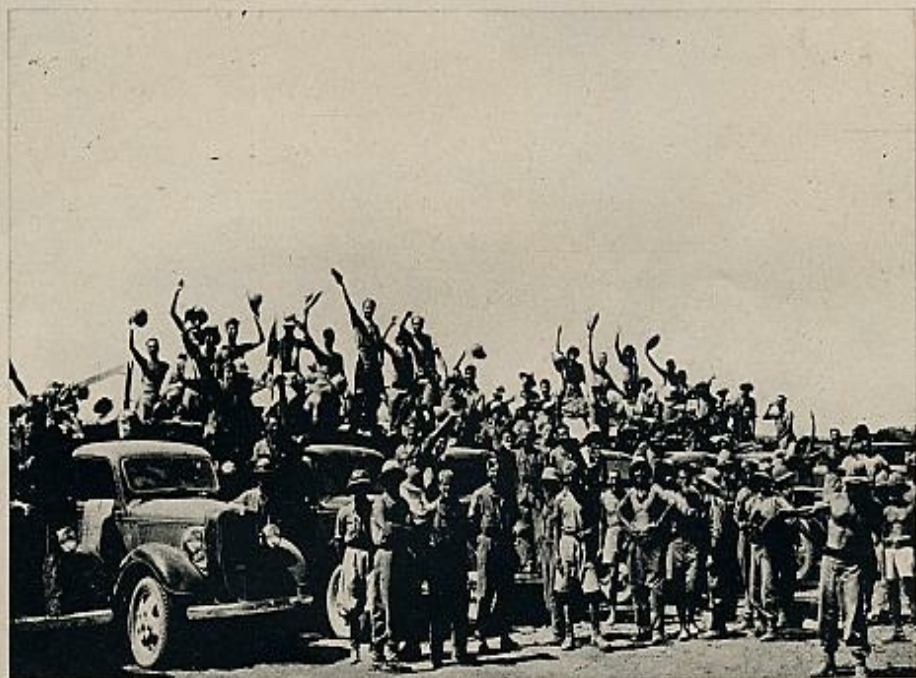
El clima bélico arrastró, por un momento, al país entero. Cada triunfo en el campo de batalla era celebrado entusiastamente por los combatientes.

ejército con los etíopes exiliados en Sudán y en Kenia. En enero de 1941 los británicos consiguieron con poca sangre —116 muertos, 386 heridos— la capitulación de las fuerzas del duque de Aosta en Etiopía; el Negus cruzó la frontera, acompañado por el coronel Wingate, y en mayo se estableció en su palacio. Ocurrió entonces que los británicos mostraron ciertas dificultades para retirarse del territorio que habían conquistado a otros conquistadores. La administración militar duró hasta enero de 1942, fecha en la cual se