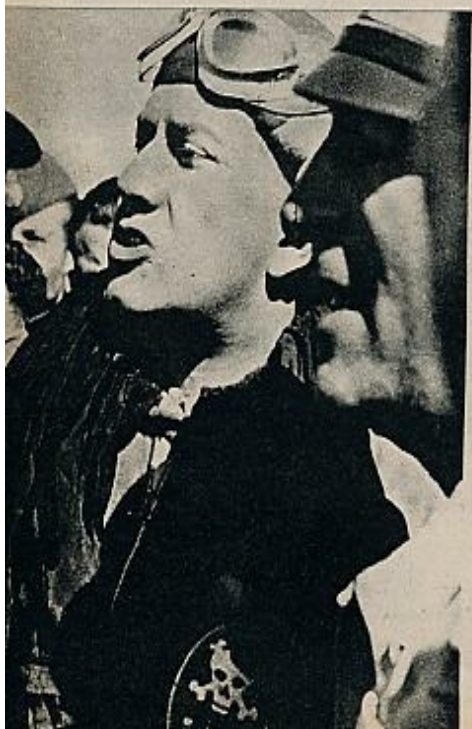
Ciano, a la izquierda, y Vittorio Mussolini y Pavolini.

mente el embargo de la gasolina y el bloqueo de ciertas materias primas que se consideraron como imprescindibles, pero que no lo fueron. Gran Bretaña llegó a mantener en estado de alarma su flota del Mediterráneo, pero no se atrevió a intervenir contra los barcos italianos, ni siquiera contra ciertos barcos contrabandistas que suministraban a Italia las mercancías embargadas. Finalmente, la situación de hecho quedó aceptada, y Etiopía desapareció como nación independiente. Cuando Haile Selassie acudió a Ginebra, en septiembre de 1936, se le negó el acceso a la sala de sesiones de la Sociedad de Naciones. El mismo lo recordaba dieciocho años más tarde, cuando, reintegrado ya a su trono, hizo una visita oficial a Ginebra. «Aquí —dijo, señalando un escaño— me senté en septiembre de 1936... Me dijeron que yo no tenía ya Estado y que no tenía derecho a sentarme a la mesa del Consejo... Me quisieron sentar en los bancos de la prensa. Así lo exigía Mussolini. Sus voluntades eran sagradas. Solamente Litvinov (el delegado soviético) intervino. Sencillamente, se dirigió al secretario general, Joseph Avenol, para decirle que él también se levantaría de la mesa del Consejo si me obligaban a mí a abandonar...».