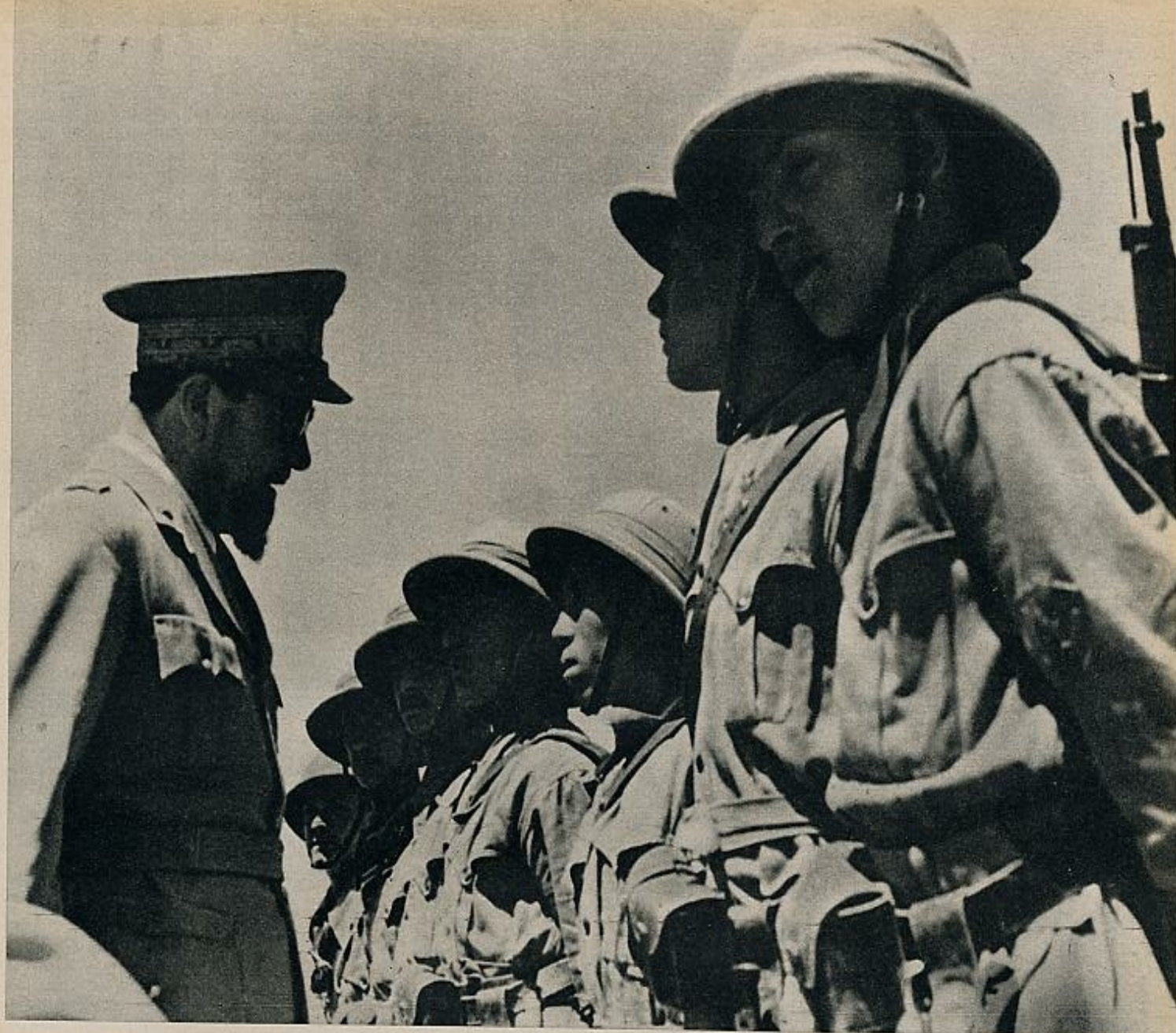
Nombrado gobernador de Libia en 1933, el mariscal Italo Balbo murió en Tobruk en 1940, al abatir su avión la artillería italiana durante un bombardeo británico.