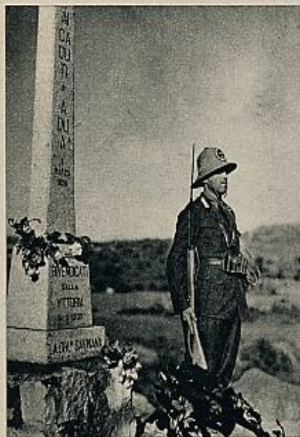
Después de la conquista, el monumento a Menelik II fue sustituido por un obelisco dedicado a los italianos caídos en la batalla de Adua en 1896.