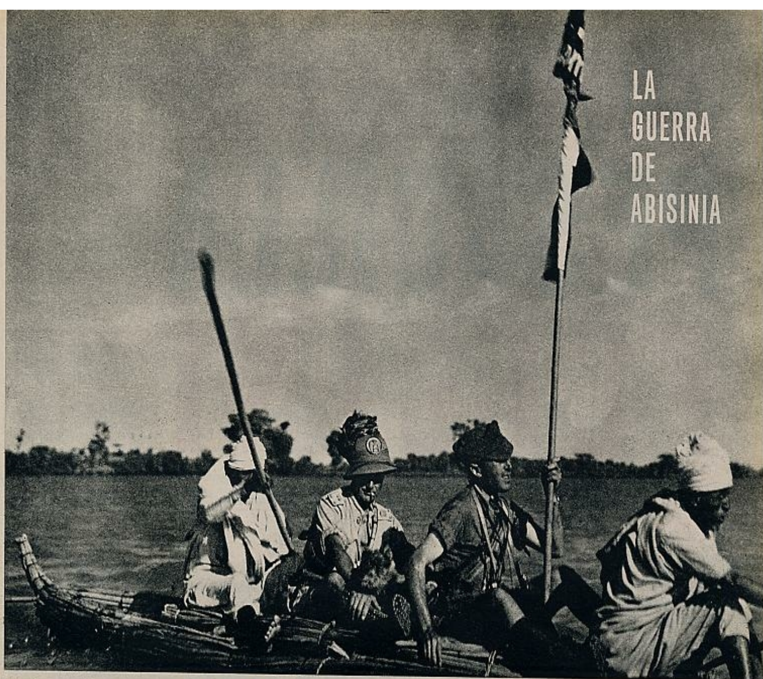
Entre las personalidades que participaron en la campaña estuvo el secretario del partido fascista, Achille Starace, que aparece en la fotografía superior atravesando el Lago Tana. Abajo, la detención de Ras Aillú, uno de los resistentes contra los que tan dura campaña llevó el mariscal Graziani, con 250.000 hombres.

firmó un pacto etíope-británico: meses más tarde se formaba un Parlamento y un Gobierno independiente. Pero la retirada de los británicos no hubiese probablemente sucedido de no mediar una presión americana. Que, a su vez, colocó un consejero en el Ministerio de Asuntos Exteriores, envió un grupo económico presidido por Stettinius, formó una compañía encargada del «desarrollo de los planes nacionales» —presidente, el general Wilson, del ejército de los Estados Unidos—. La Sinclair Oil obtuvo una amplia zona de investigación petrolera. John D. Rockefeller inauguró una serie de viajes de hombres de negocios americanos... El Negus fue suficientemente inteligente como para aceptar también la ayuda soviética y buscar así —dando ejemplo a otros países subdesarrollados— el equilibrio entre los dos campos opuestos que puede permitir una apariencia de independencia. Aún Etiopía está muy lejos de la democracia. Sin sindicatos, sin partidos políticos, con prensa mediatizada. Pero de Addis Abeba han salido los primeros movimientos de Unión Africana; y se realizan interesantes esfuerzos por el establecimiento de programas de revaloración económica.