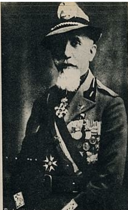
El mariscal Emilio di Bono fue una de las principales figuras de la conquista italiana. Más tarde fue mandado fusilar por Mussolini en Verona.

De aquella confusión brotó al mundo un nuevo personaje. Era cómico y conmovedor al mismo tiempo. El Negus, tímido, diminuto, to-