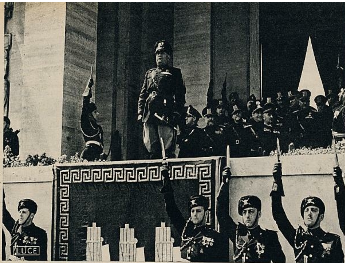
El Duce fue tajante desde un principio en lo referente a la entonces Abisinia y hoy Etiopía. Ante los letrados que anunciaban el camino de Addis Abeba, la capital, los soldados se hacían fotos conmemorativas. Y el 5 de mayo de 1936 los italianos realizaban su conquista. Días después Mussolini entregó a Víctor Manuel el título de Emperador de Abisinia.

las tropas italianas que habían sido acumuladas en Eritrea violaron la frontera de Etiopía y comenzaron la invasión. El sobresalto se produjo inmediatamente en todas las capitales del mundo. El centro nervioso de la diplomacia mundial era entonces Ginebra, sede de la Sociedad de Naciones; fue allí donde se desarrolló la batalla diplomática.