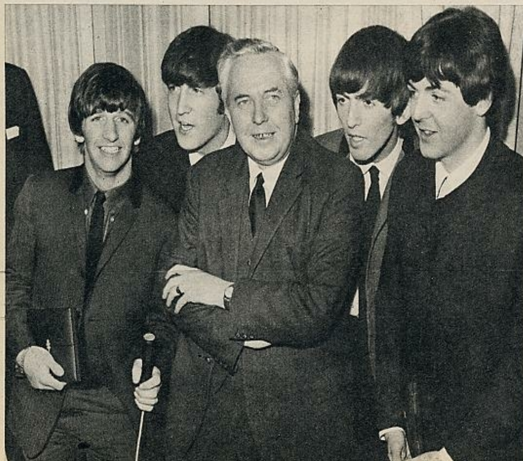
La Reina ha condecorado, en años sucesivos, a los Beatles —que aparecen con Wilson en la foto inferior, cuando le apoyaron en su campaña electoral— y a Mary Quant, la promotora de la minifalda, que no deja de ser un elemento más de la dialéctica sexual y se ha impuesto definitivamente.

les. «El primer movimiento de liberación debe ser una liberación "del" sexo. Hasta aquí se está entendiendo que la "revolución sexual" es simplemente una mayor tolerancia. Pero si fuese solamente eso, no representaría en absoluto una revolución. Sería solamente un episodio en el balance histórico entre el control y la licencia, entre Apolo y Dionisos. Pero estoy seguro de que se trata de algo más que de eso». «Un aspecto de la revolución es el de liberarse de la explotación y de la comercialización de las cuestiones sexuales, bajo cuya presión y sugerencia los jóvenes, particularmente, son mucho menos libres».