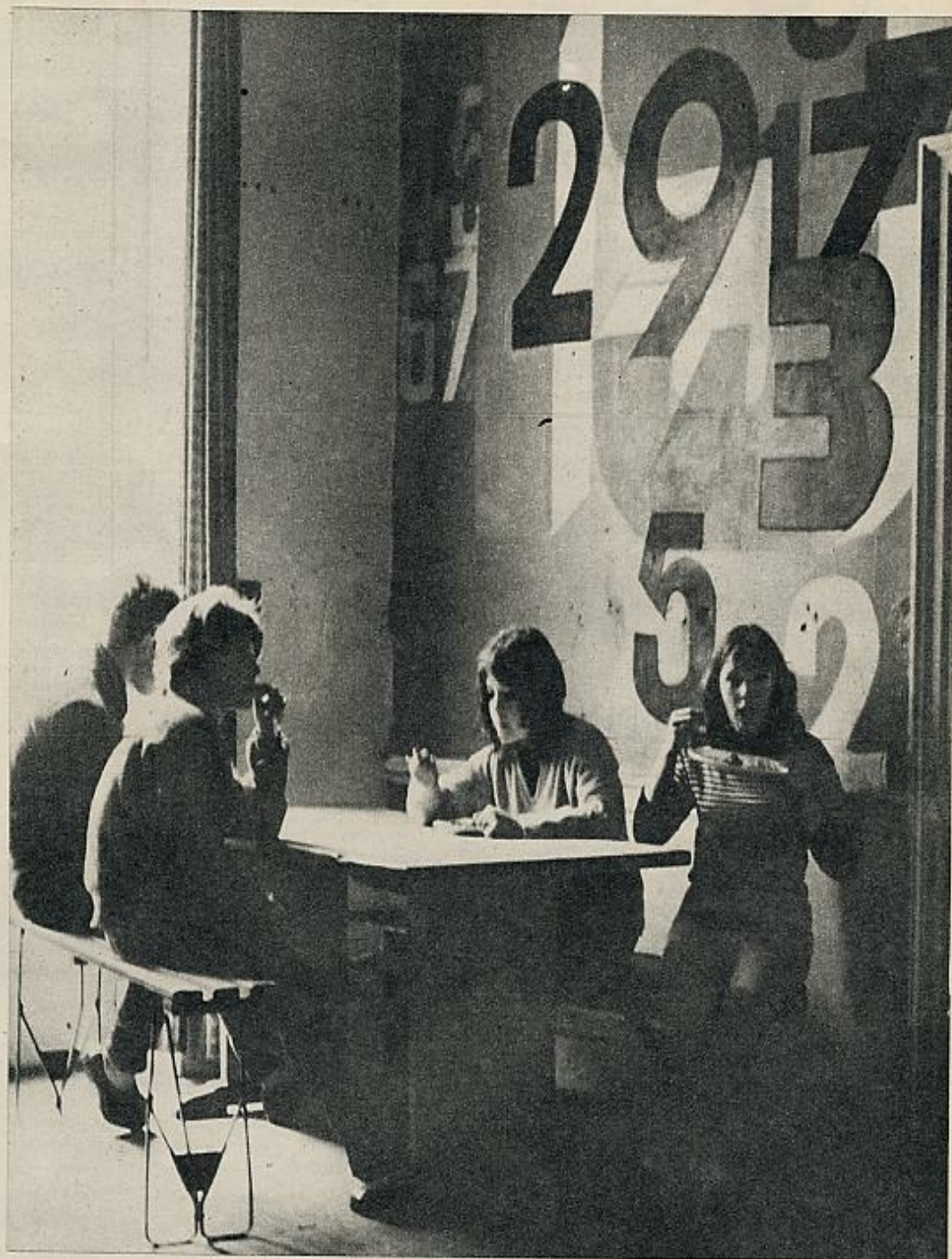
Al hablar de la enseñanza en Inglaterra se hace siempre referencia a las tradiciones de Oxford y Cambridge, a las «public schools», pero se olvida la experiencia de las «progressive schools», en las que conviven, en régimen de comunidad, muchachos y muchachas, que tienen una libertad absoluta en todos los sentidos, incluido el planteamiento de sus relaciones personales.