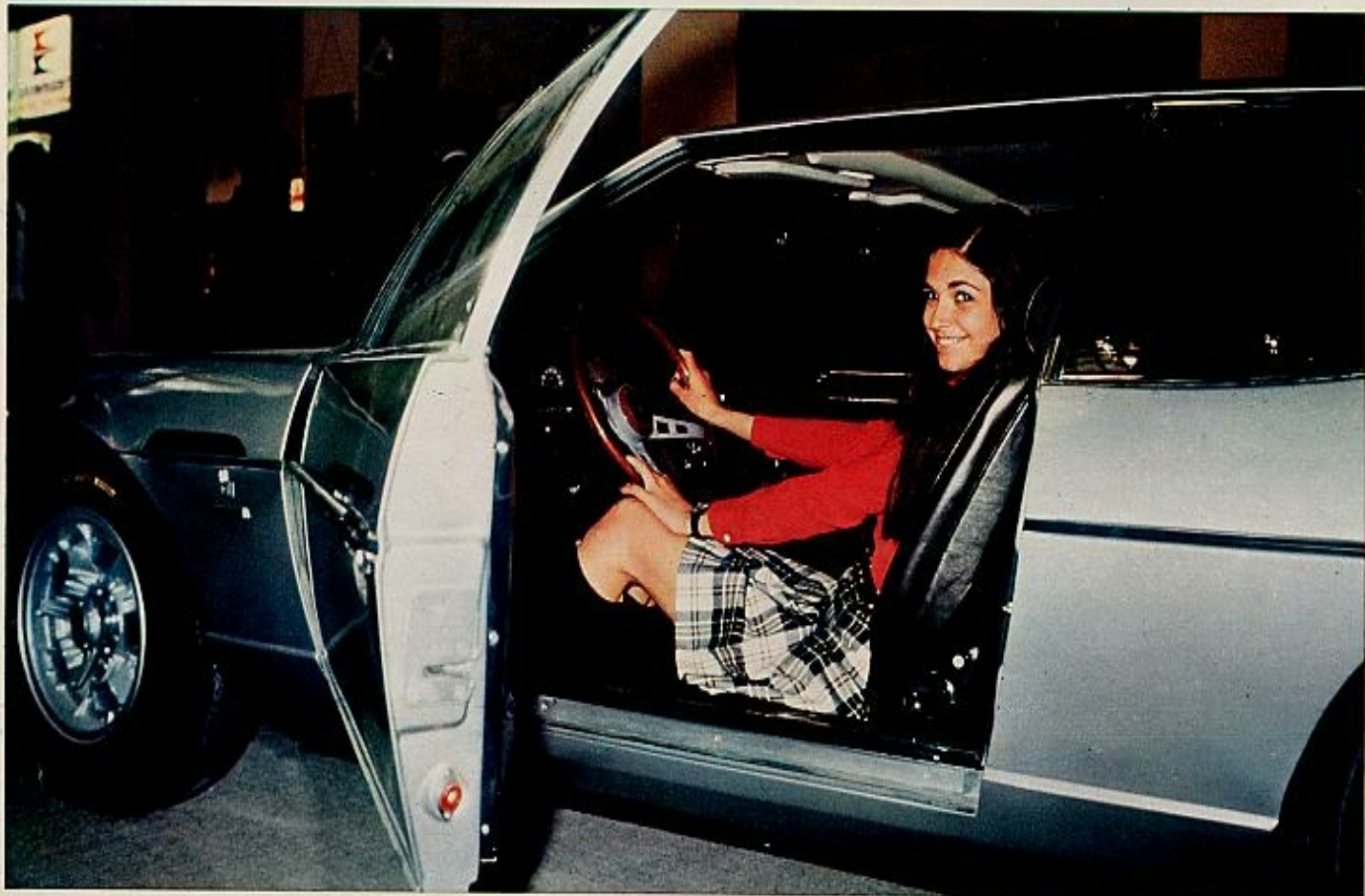
El lujoso Espada, de la «ganadería» Lamborghini, al igual que el famoso Miura, que tuvo un gran éxito en el anterior Salón del Automóvil barcelonés...