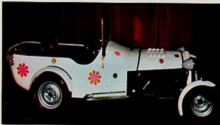
Automóvil con tendencia «hippy»: el inglés Opus, que alcanza gran velocidad.