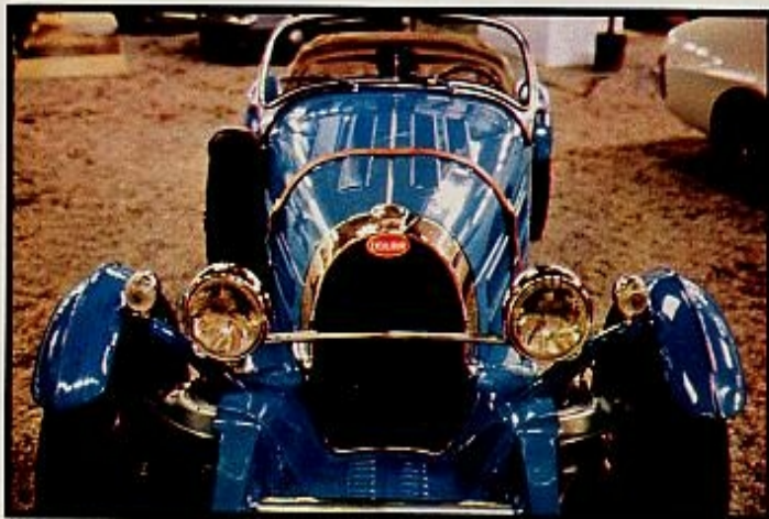
Un antiguo Excambur, nostálgico, de otra época, fabricado sobre un Opel.