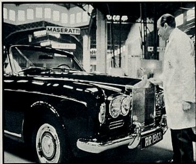
El «stand» de la casa Bentley, con uno de sus modelos. El Bentley sigue la línea tradicional del automóvil británico: solidez, clasicismo y seguridad ante todo.