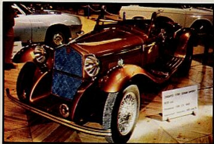
El Zagato, un moderno motor Alfa Romeo montado en una carrocería antigua.