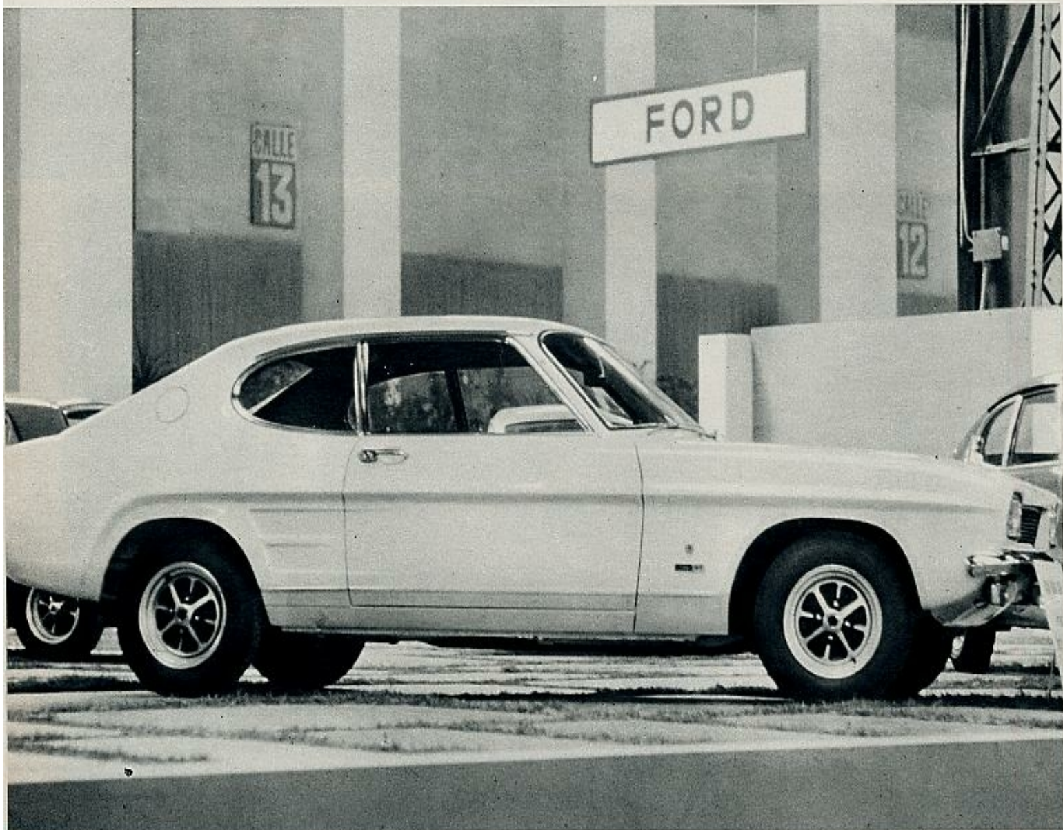
El nuevo Ford Capri, versión reducida del conocido Ford Mustang, «co-protagonista» de «Un hombre y una mujer», representante de los «grandes» americanos.