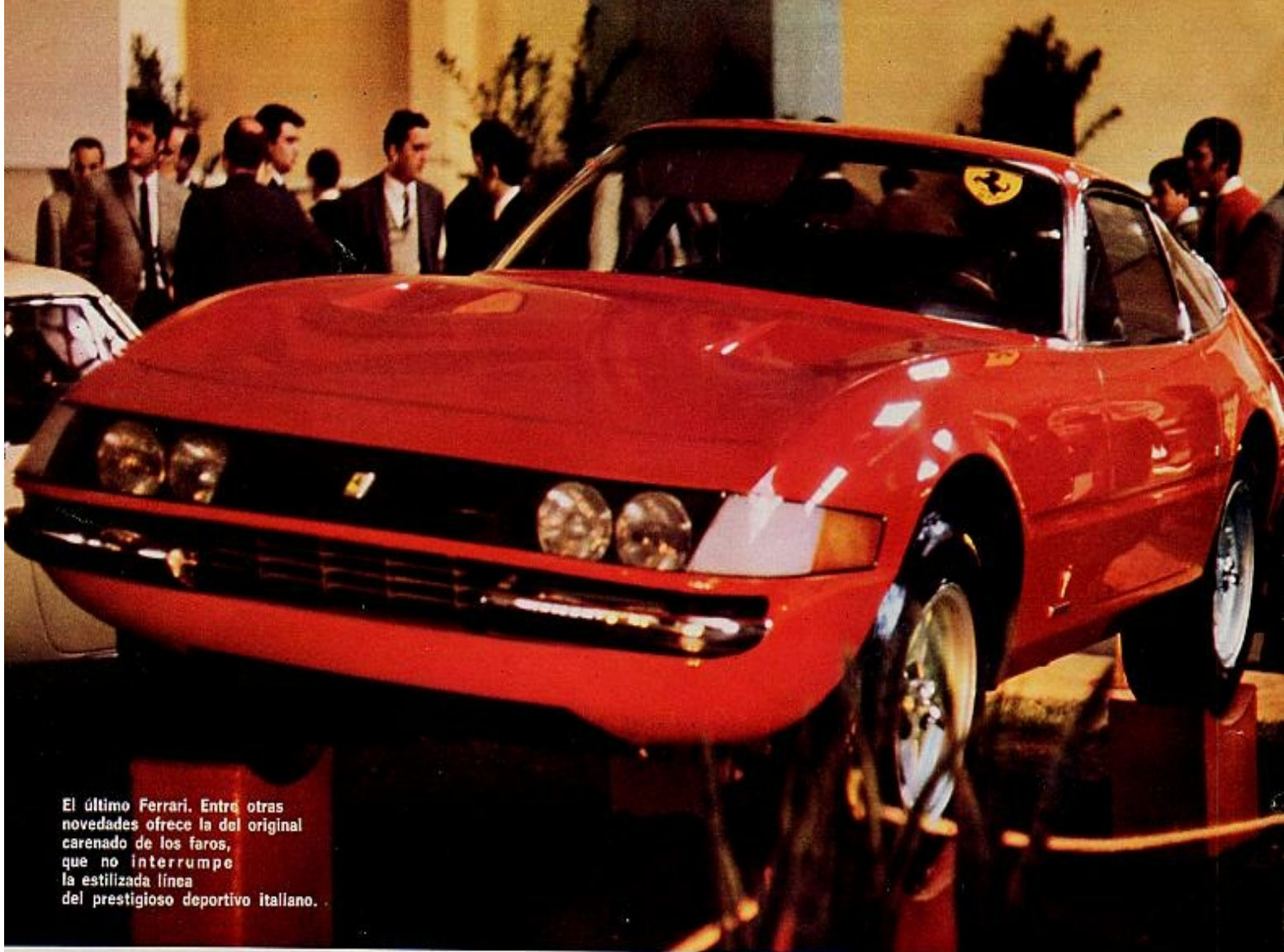
El último Ferrari. Entre otras novedades ofrece la del original carenado de los faros, que no interrumpe la estilizada línea del prestigioso deportivo italiano.