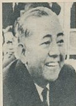
SATO: «COMPAÑERISMO» CON USA.

Las elecciones de fin de año en el Japón han confirmado en el poder a Eisaku Sato (partido liberal-demócrata) durante cuatro años más. La brillante victoria electoral (288 escaños en un parlamento