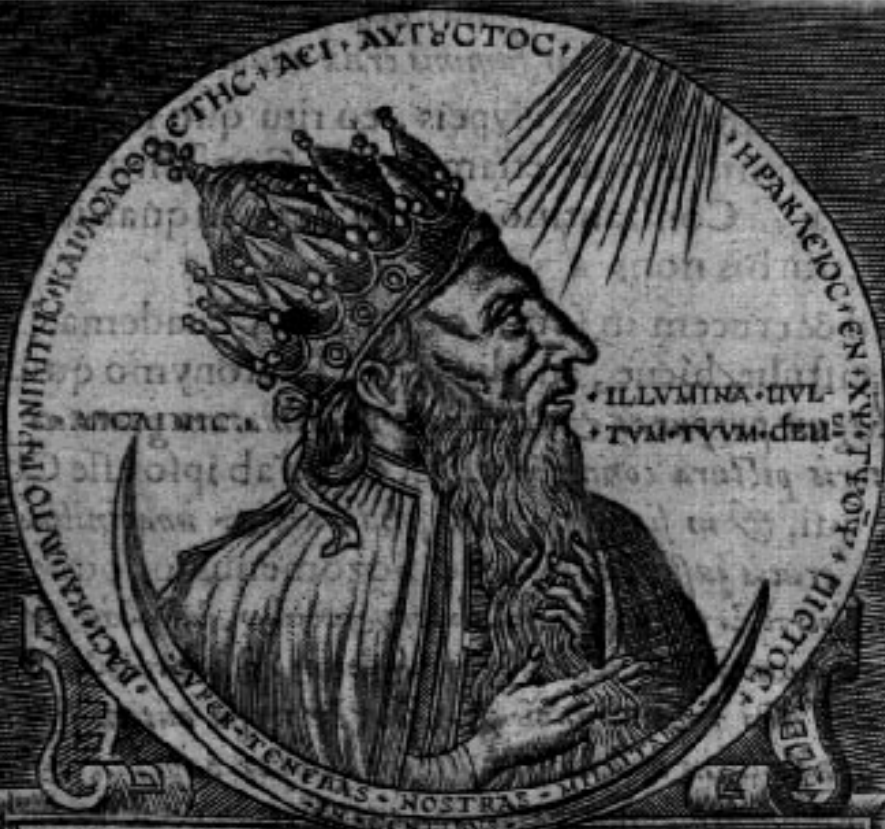
Heraclij Imp. nummus aereus.