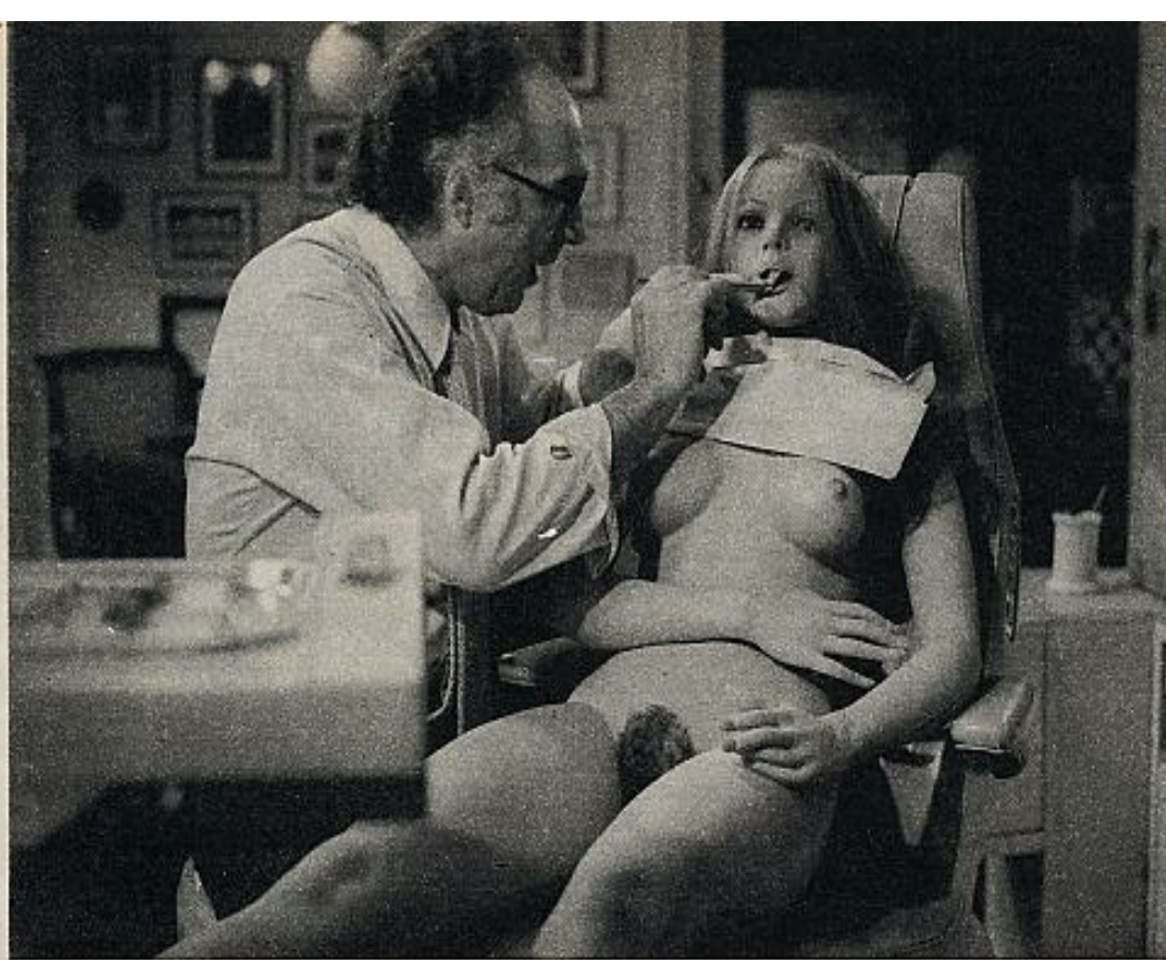
Fotograma de la película "Tamaño natural", de Luis Berlanga.

pronto irrumpen en la vida de hombres que no responden a esas características (el dentista del film de Berlanga, por ejemplo); de hombres desinhibidos, inteligentes y acostumbrados a la lida con el sexo opuesto. ¿El símbolo ha sustituido al sujeto real y lo desplaza? Si bien en los "sex-shops" y en los anuncios de publicidad resulta evidente su carácter de réplica (sustituyen a la mujer real, inaccesible por cualquier motivo), tanto en Tamaño natural como en el cuento Las hortensias , del uruguayo Felisberto Hernández (hay edición española: Lumen, 1974), y en otros casos semejantes, hay una clara elección por parte de los protagonistas, un desplazamiento de la función de réplica hacia la entidad real. Las muñecas no reemplazan a la mujer; son la mujer, y, en la competencia entre las de carne y hueso y las de poliuretano, salen triunfantes estas últimas. En otros casos (hay ejemplos en la literatura de ciencia-ficción que, como se sabe, es menos ficción de lo que parece), el modelo ha desaparecido por completo: la muñeca ha eliminado a la mujer, esa imperfecta antecesora.