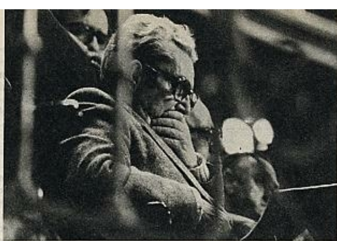
Marcelino Camacho interpeló al ministro de Trabajo sobre el problema de Land Rover Santana, donde más de veinte obreros de Comisiones han sido expulsados. Junto a él, Sánchez Montero y Cabral (diputado comunista por Cádiz); detrás, Ramón Tamames...