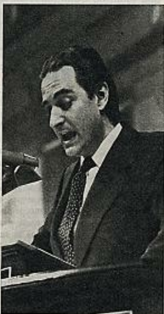
Landelino Lavilla, ministro de Justicia: están tomadas todas las medidas. Lavilla respondió a una interpellación del diputado catalán Roca.

Y llevado de ello, el ex ministro Carro pidió, entre trémos y trenos, una vía rápida para Galicia. ■ V. M. R.