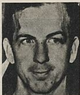
Lee Harvey Oswald.

Oswald había nacido el 18 de octubre de 1938, en Nueva Orleans; en el 56 se alista en la Infantería de Marina de su país, cuando ya ha manifestado tendencias socialistas, leído libros marxistas e incluso pretendido algún contacto organizativo. De su regreso del Japón, en donde ha aprendido algo de ruso y se ha interesado por el régimen soviético a través, se supone, de contactos con comunistas, decide renunciar a su ciudadanía norteamericana y pretender la soviética. Pasa un par de años en la URSS, a quien ha ofrecido información interesante al entrar, y donde se casa. El Gobierno desprecia su ayuda y no es aceptado. Se ve obligado a dar vuelta a las cosas y regresa a su país de origen, manteniendo una postura de denuncia ante el régimen que ha abandonado los principios de Marx y Lenin, y al mismo tiempo una crítica al imperialismo americano. Cree en una acción directa y violenta y busca apoyo ruso o cubano —para lo cual lleva a cabo un trabajo aparentemente procastrista en solitario—, para desarrollar un trabajo que va a consistir: primero, en atentar contra el general Walker, peligroso fascista, y luego matar al Presidente Kennedy, curiosamente en el momento de una ofensiva yankee contra Cuba y de un plan para el asesinato de Castro. El mismo día del atentado y de la detención de Oswald, éste cae abatido también por otras balas. Luego está el miste-