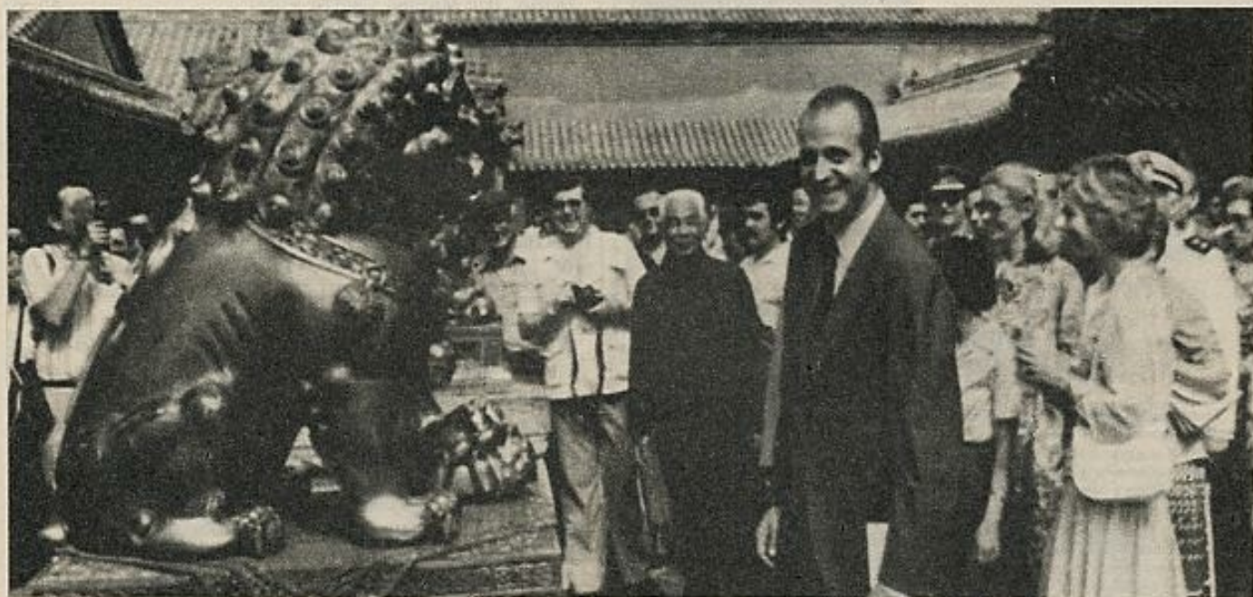
El Jefe del Estado español, ante uno de los leones del palacio de la Ciudad Prohibida de Pekín.

L UEGO está la cuestión del quién. ¿A quién han beneficiado los pasos adelante, a quién el no haber dado todos los que se tenían que dar? No hay reforma agraria, no ha cambiado la enseñanza, los salarios siguen corriendo detrás de los precios, las dictaduras privadas —empresas, familias, relaciones de poder y dominio apenas han cambiado— y ocurre que una considerable mayoría de españoles encuentran que las libertades concedidas se están considerando, en las declaraciones