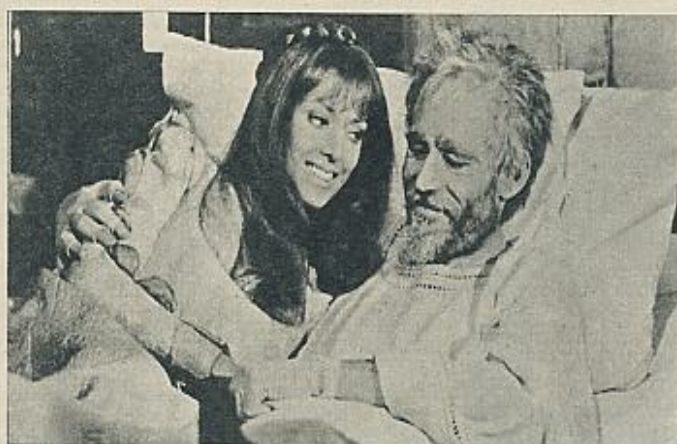
«El hombre de la Mancha» («The man of la Mancha», 1972), de Arthur Hiller.

vela de Cervantes, sino «El hombre de la Mancha», comedia musical de Dale Wasserman y Mitch Leigh, inspirada —eso sí— en aquella. Se produce así un conglomerado bastante heterogéneo, donde los elementos recogidos aquí y allá de la obra cervantina vienen mezclados con características típicas y tópicas del «musical» neoyorquino estilo «gran Broadway». Sin conocer el montaje escénico, creo que Hiller ha utilizado para su film la misma estructura narrativa que sustentaba el espectáculo teatral. De donde se deriva el mayor atractivo y el mejor de los bastantes escasos aciertos existentes en la película. Que se nos ofrece como una ficción recreada por Cervantes en la cárcel de Sevilla ante sus compañeros de presidio. Más exactamente, queriendo salvar el manuscrito del «Quijote» ante los demás presidiarios que la forman un juicio para ver si es digno de conservar sus posesiones personales, el literato les propone un juego: escenificar entre todos aquello mismo que cuenta su manuscrito; él será don Quijote; su criado, Sancho Pancho, y los encarcelados incorporarán los restantes papeles. Aprovechando un baúl de efectos teatrales que Cervantes lleva consigo, se irán maquillando conforme convenga a los distintos personajes. La imaginación hará el res-