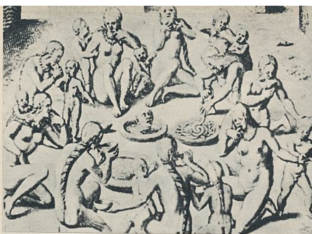
Festín antropofágico ritual practicado por los indios tupinambas (América del Sur).

ber sido rascadas. Ello parece demostrar que los canibales no comían el cuerpo del hombre sacrificado, sino que por regla general se limitaban a consumir los cerebros.