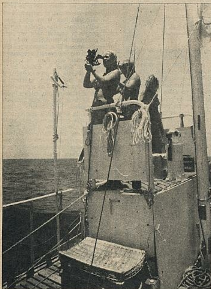
La validez de este experimento radica principalmente en el significado de convivencia que tuvo el proceso general de relación de sus participantes, que no tuvieron la oportunidad de autoseleccionarse, que se vieron obligados a conocerse profundamente y tuvieron que romper muchas inhibiciones y convencionalismos fuertemente arraigados por la educación.

Antropólogo, participante en el experimento «Acali».