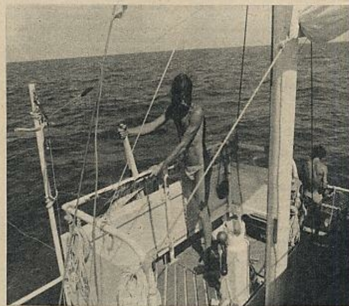
La balsa «Acali» atravesó el océano Atlántico y el mar Caribe, en ciento un días de navegación, recorriendo una distancia de 4.652 millas marinas. En la foto, el autor de este trabajo, integrante de la tripulación de la «Acali».

experimento Acali, no se improvisó durante el viaje. Fue cuidadosamente planeado como método de investigación, con mucha anterioridad a la partida de Las Palmas. Las intenciones y el significado del proyecto fueron dados a conocer al público a través de la prensa con el mayor detalle posible, y aun por medio de informes ya redactados. Lamentablemente, fueron pocos los sectores de la información mundial que se interesaron