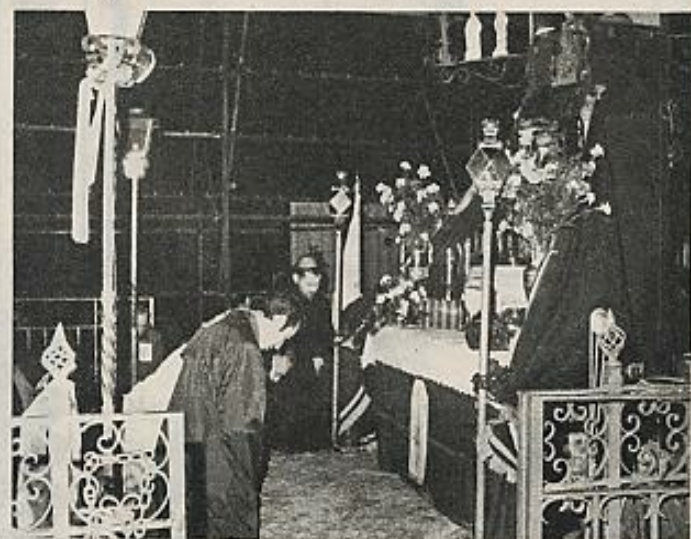
El Palmar de Troya.

Doscientos años después, de esta triada los españoles sólo echamos de menos la peste. Aunque, bien mirado, ¿qué peste peor que el despotismo? Sobre todo cuando, como es nuestro caso, se trata de un despotismo analfabeto o, lo que es igual, analfabetizador (reléanse, al