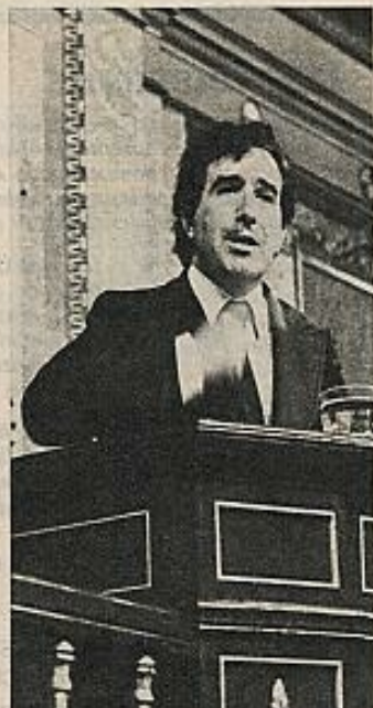
Luis Gómez Llorente, la dignidad de la Cámara.