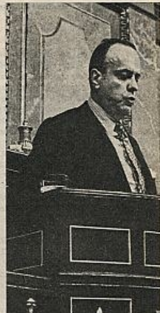
Manuel Fraga Iribarne, el hombre de las Fuerzas de Orden Público.