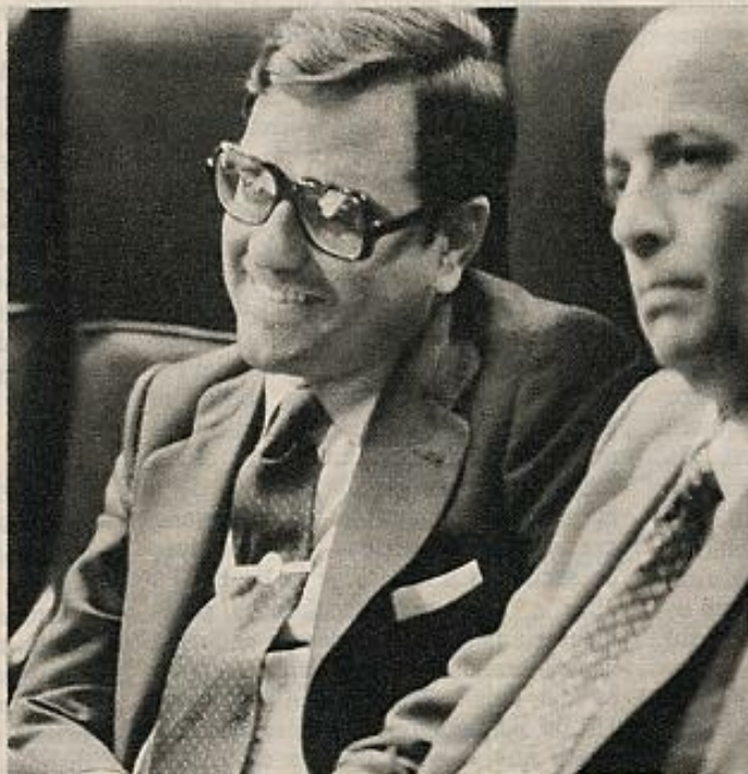
Rodolfo Martín Villa, el antiguo jefe nacional del SEU y hoy ministro blanco de los ataques del PSOE. A su lado, Fernández Ordóñez. Martín Villa sonríe ante las bromas de Carrillo.