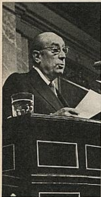
Enrique Tierno Galván, hacen falta estadistas más que políticos.

LA BATALLA DEL CONSEJO DEL REINO, número 758, 6 de agosto.