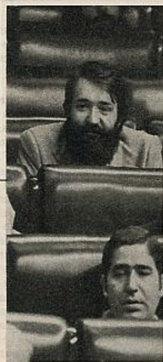
Jaime Blanco, diputado del PSOE por Santander.