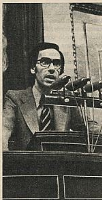
Alfonso Guerra, el acusador público de Martín Villa.

¿A quién miró entonces mientras posaba sus ojos en los riscos de Alianza Popular? ¿A don Gregorio López Bravo ("nadie más cortésano y pulido")? ¿A don Gonzalo Fernández de la Mora, que el día anterior estuvo toda la tarde con la mano en la mejilla, no sé si con el dolorido sentir garcilasiano o sumido en orteguiana meditación? ¿A Carro Martínez, que a veces sostiene su poderoso mentón en las manos apoyadas en el respaldo del escaño delantero?