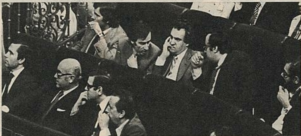
La alternativa al "banco azul": Felipe González, Alfonso Guerra, Enrique Múgica, Gregorio Peces-Barba, Javier Solana. Delante, los ministros Camuñas, Clavero, Sánchez de León y Cabanillas.

Si Gómez Llorente levanta el dedo derecho, don Enrique Tierno Galván alza el izquierdo. Pero su dedo no es acusador, sino de advertencia. Con diapasón más bajo parece decir: "Hacedme caso, que sé lo que digo". Pide el profesor Tierno menos política de partido. Cosa comprensible en quien tiene el suyo maltrecho, podría aducir un mal pensado. Política de estadistas y no política de políticos pide también el llamado "viejo profesor", que, por fortuna, no es tan viejo. Y al hablar de soluciones a la grave situación española, sus reproches pueden ir tanto a un partido que se esfuerza por mantenerse dentro del Gobierno como a otro que hace todo lo posible por mantenerse fuera de él. También reprochó el silencio patriótico impuesto por la ponencia constitucional en torno a sus debates. El profesor de Derecho Político mostraba a la Cámara el insulto al sentido común que su-