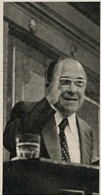
Santiago Carrillo, la mano derecha para reconvenir al Gobierno.