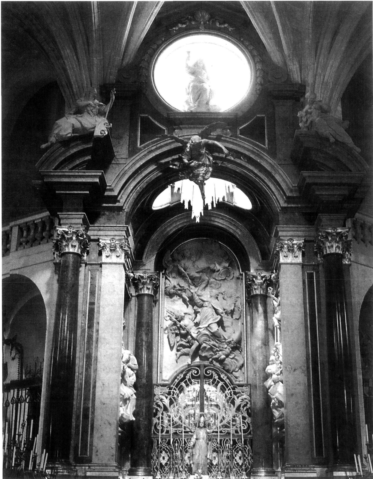
Transparente de la catedral de Cuenca, en el que se custodia el sepulcro de San Julián. ROKISKI LÁZARA, María Luz: Arquitectura de Cuenca . Toledo, 1995.