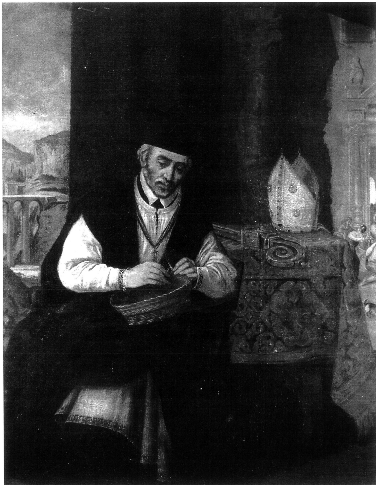
Representación de San Julián. SÁIZ, Santos y MARTÍNEZ, Anastasio (coords.): Catálogo monumental de la diócesis de Cuenca . T. I. Madrid, 1987.