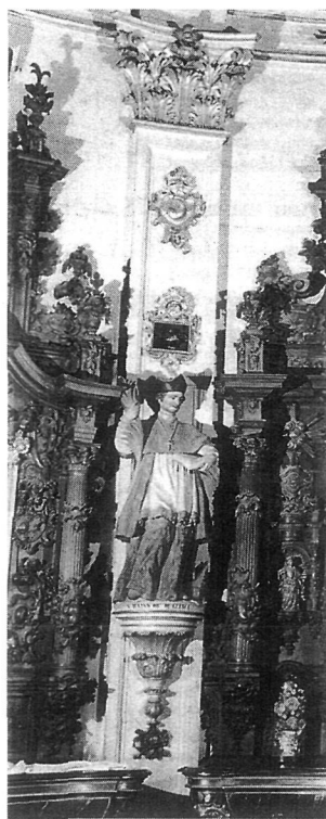
Escultura de San Julián en la sacristía de la catedral de Burgos.

De ahí que la Iglesia no escatimara en medios para ensalzar la importancia de las reliquias, sobre todo a través de la organización de diversas ceremonias relacionadas con las mismas, entre las que sobresalieron las traslaciones. La nueva piedad tridentina, de carácter exaltado y extremo, encaminada a excitar la devoción de las gentes mediante resortes visuales, convirtió estas traslaciones en actos de marcado carácter teatral (de igual manera que sucedió con otros acontecimientos religiosos, como las procesiones del Corpus, las canonizaciones o las exequias reales), cuya riqueza y esplendor eran del gusto de un pueblo que siempre se mostró atraído por lo maravilloso y lo sorprendente. Estos actos fueron aprovechados para celebrar grandes festejos en los que lo sacro y lo profano se entremezclaban para crear una falsa ilusión de grandeza que creaba la idea de que la Iglesia seguía siendo, a pesar de la crisis de la época, una institución poderosa a la que las gentes podían seguir confiando la salvación de sus almas, algo indispensable para la continuidad del estamento eclesiástico.