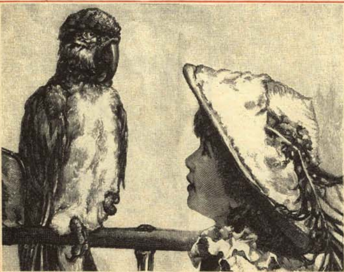
—También vosotros lleváis no sé cuántos años repitiendo lo mismo.