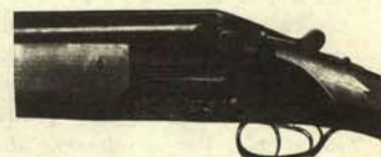
Escopeta en posición de enviar la ideología.