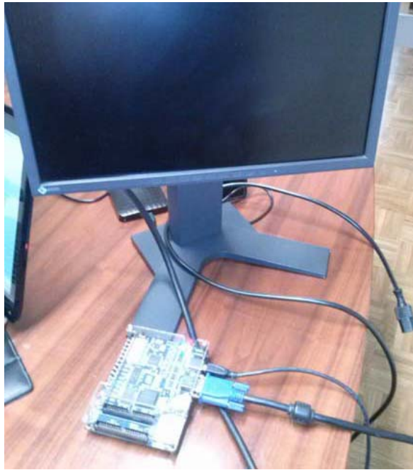
Figura 1. Sistema experimental con FPGA.

Como objetivo final de este Proyecto, se han determinado las líneas a seguir en la asignatura Sistemas de Entrada/Salida. Asimismo, se ha elaborado parte del material docente que se empleará durante el desarrollo de la misma. En particular, se ha elaborado un robot controlado mediante un Arduino y que incorpora un sensor de ultrasonido que permite calcular la distancia a la que está situado un posible obstáculo y un puente H para el control de los servomotores cuyo movimiento permite esquivar dicho obstáculo de forma programada. En la Figura 2 se observa el robot fabricado.