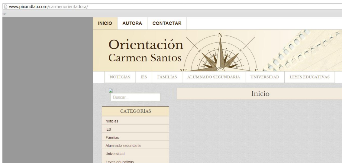
Figura 1: Interfaz de la WEB.

Como se puede ver en esta figura, la WEB tiene una apariencia sencilla en la que el visitante podrá encontrar a la izquierda y en el menú principal de la página, el índice de categorías sobre distintos temas, que pinchando en cada uno de ellos nos llevará a otros. Estas categorías son: