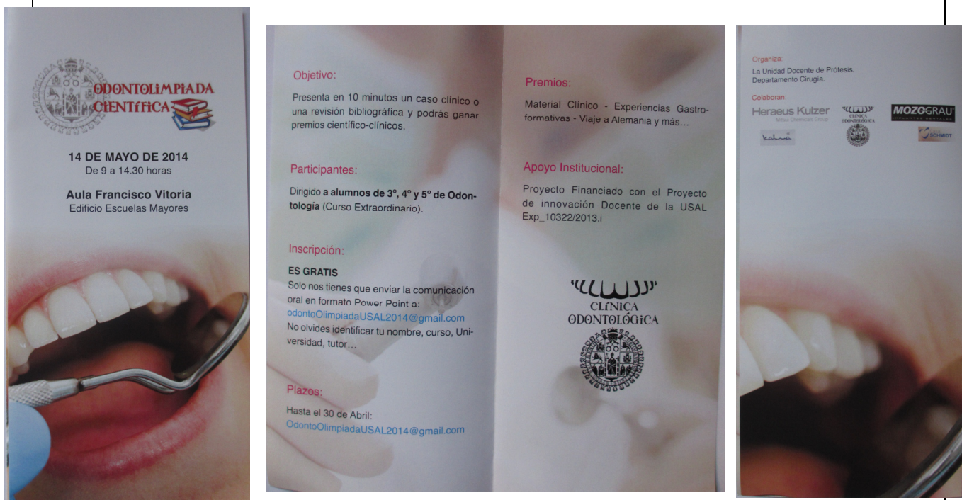
Figura 1: Diseño de Dípticos