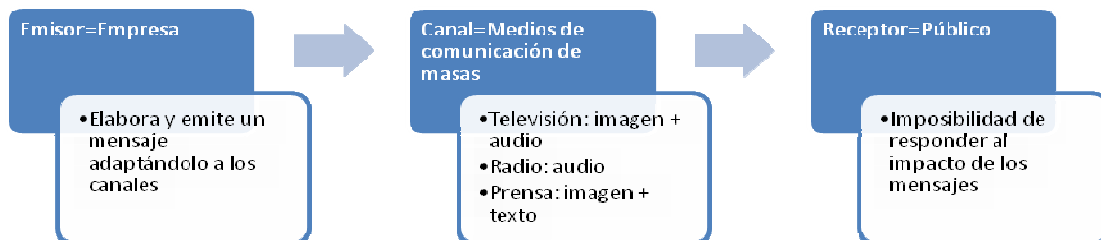
Gráfico 1. Comunicación corporativa pre-internet

Como mucho diseñamos acciones concretas para segmentos de públicos con el objetivo de evitar ruidos en los canales