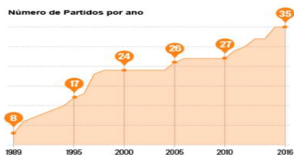
Figura 11 – Número de partidos políticos en Brasil entre 1989 y 2016