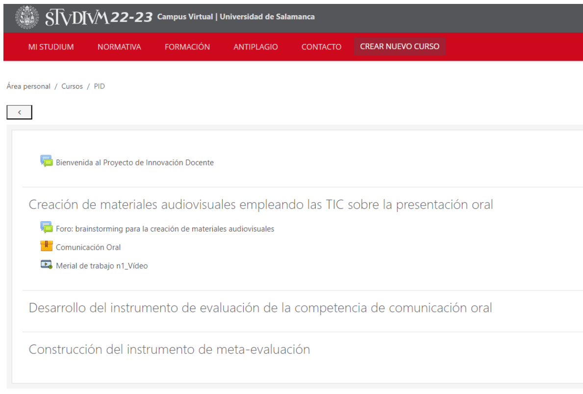
Figura 2. Ejemplo del curso creado en Studium para el proyecto