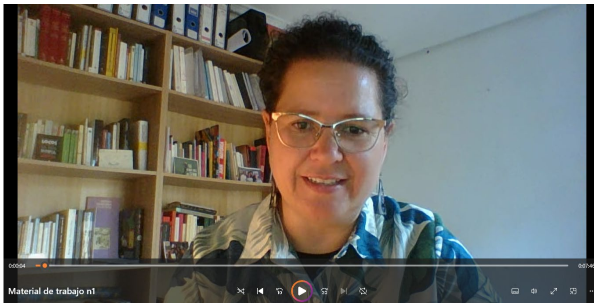
Figura 1: Captura de pantalla del vídeo correspondiente al material de trabajo nº1.

clase, etc. Estas consideraciones fueron el punto de partida para la creación de este primer material de trabajo, que aportó información a los estudiantes sobre cómo enfocar sus comunicaciones orales en función del público al que van dirigidas. El presente vídeo fue grabado por la coordinadora del proyecto recogiendo las principales conclusiones alcanzadas tras esta primera fase de reflexión.