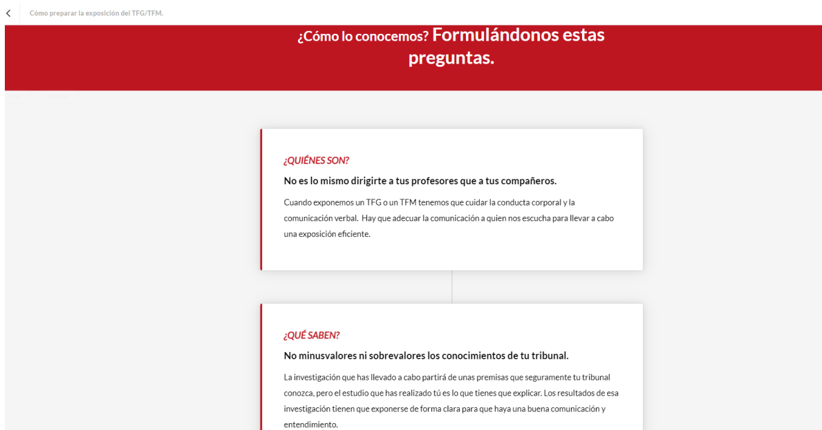
Figura 3. Ejemplo de los contenidos diseñados en formato web