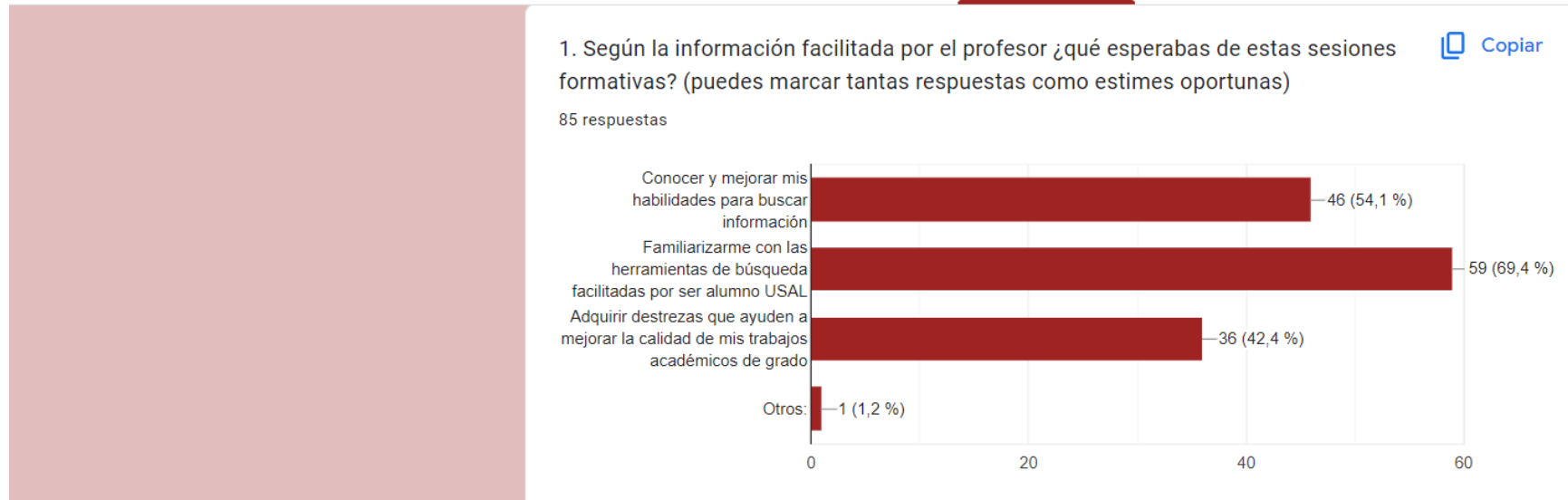
Fig. 2. Resultado obtenido en el apartado de expectativas de Alfabetización académica . Asignatura: Introducción a la Historia del Arte I . 1º Grado en Historia

En todos los casos, los alumnos han mostrado su satisfacción por la claridad de las explicaciones y por la atención y el 76,2 % de los que han respondido consideran que el tiempo dedicado a esta formación es suficiente. De sus respuestas, llama la atención el interés suscitado entre el alumnado por estos contenidos y, sobre todo, lo que esperan mejorar en los siguientes cursos académicos (Fig. 3). Recogemos, a continuación, algunas de sus impresiones: