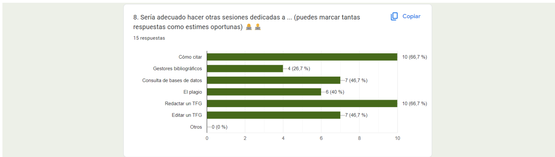
Fig. 6. Resultado obtenido en el apartado de ideas para futuras sesiones en Alfabetización académica . Asignatura: Historia de la fotografía . 4º Grado en Historia del Arte

Para finalizar, queremos incorporar la opinión de los estudiantes, quienes un año más consideran que es preciso dedicar otras sesiones para completar esta formación (Fig. 6).