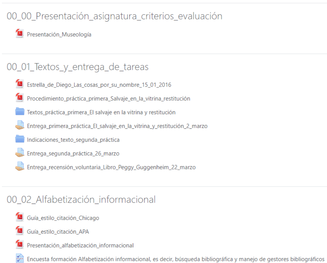
Fig. 1. Aspecto del espacio habilitado en Studium a la documentación sobre la Alfabetización académica . Asignatura. Museología . 3º Grado en Historia del Arte y Humanidades

Las presentaciones y los contenidos de cada sesión estuvieron a disposición de los alumnos a través de la plataforma Studium , lo que ha fomentado su utilidad mediante la libre consulta del material empleado en el aula (Fig. 1).