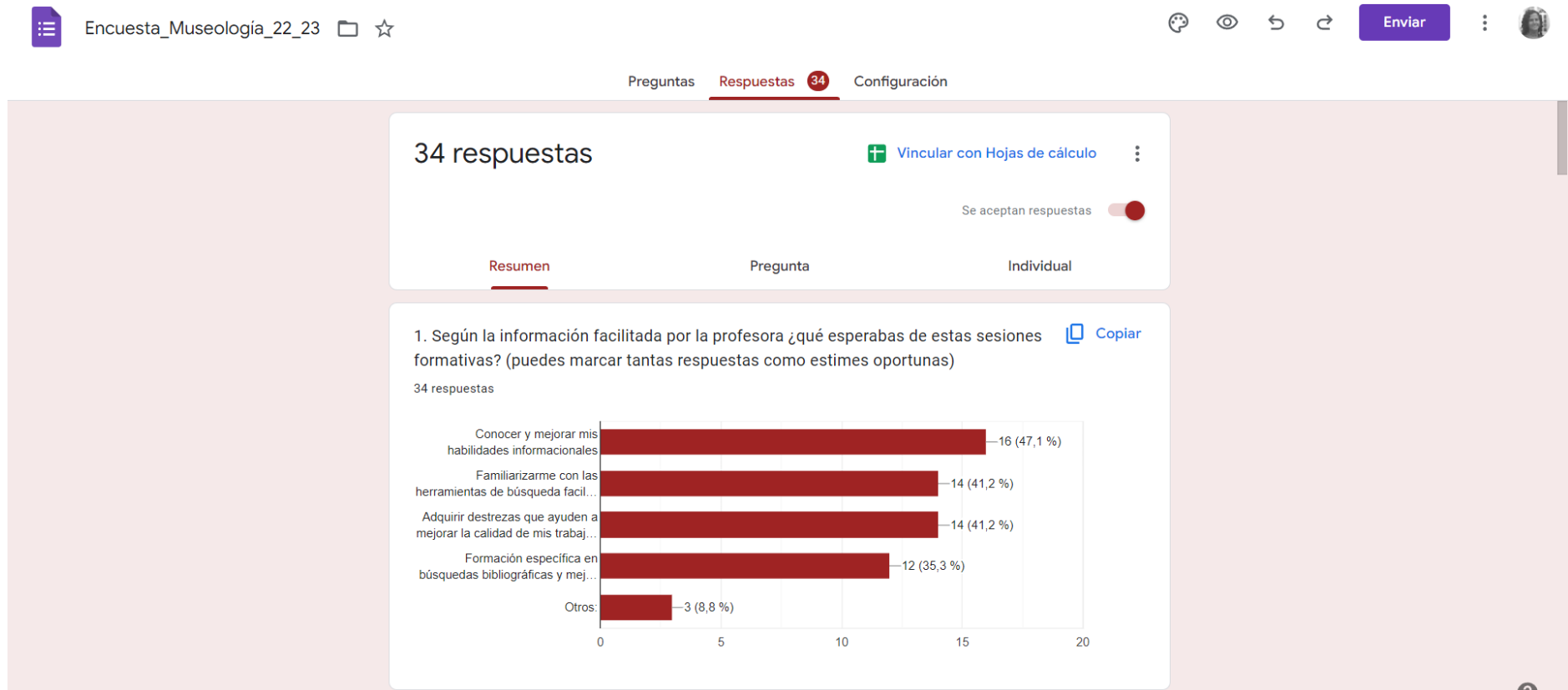
Figura 4. Resultado obtenido en el apartado de expectativas en Alfabetización académica . Asignatura: Museología . 3º Grado en Historia del Arte

Éstos mostraron unas expectativas muy altas y variadas de esta formación, confiando en conocer y mejorar sus habilidades informáticas y familiarizarse con las herramientas de mi editor de texto tras la primera sesión ofertada (Fig. 4).