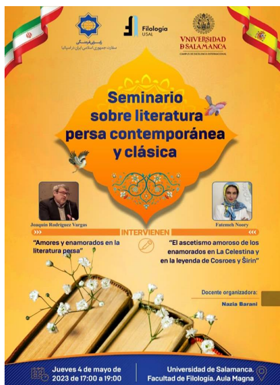
Figura 3. Cartel del seminario “Literatura persa contemporánea y clásica”

-Organizadora y presidenta del Seminario “Literatura persa contemporánea y clásica” celebrado en la Facultad de Filología, 4, 5, 2023.