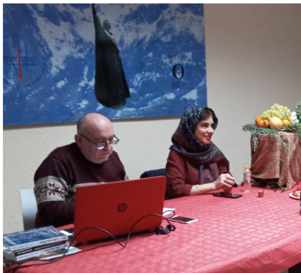
Figura 6. Fundación Santiago Pérez Gago en Salamanca

-Barani en el evento poético-musical "En la Noche más Buena", celebrado en la sede de la Fundación Santiago Pérez Gago en Salamanca, habló sobre "la Noche de Yalda", 17, 12, 2022. Disponible en https://www.youtube.com/watch?v=fnjZB-fjMj4