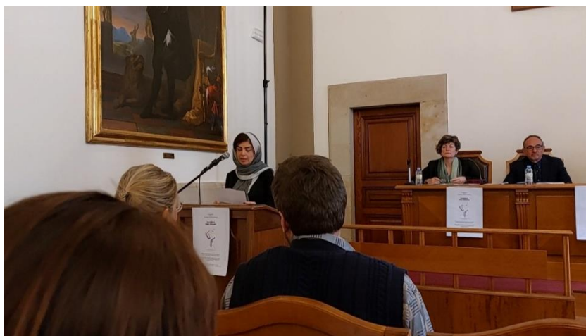
Figura 5. Facultad de Filología

-Lectura pública del poema “Es todo lo mío, y se llama Ucrania”, en el acto “Palabras para Ucrania”, 12, 04, 2023, Facultad de Filología.