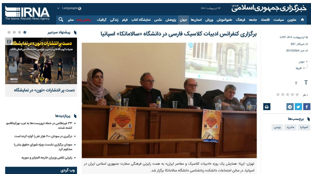
Figura 4. La noticia salió en la prensa persa, por ejemplo: https://irna.ir/xjMnrQ

-Traductora del poema de Lina Kostenko “Es todo lo mío, y se llama Ucrania”.