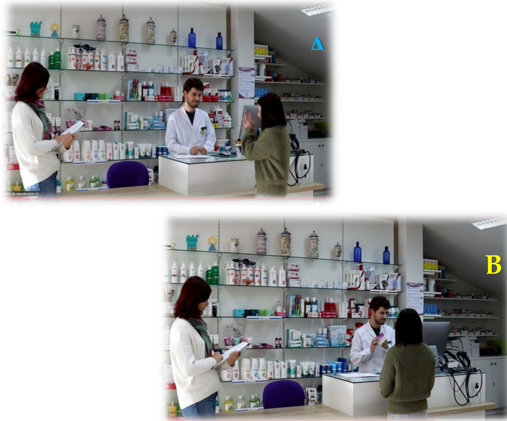
Figura 1. Vídeos de ejemplo grabados con la colaboración de personal de la Facultad de Farmacia A (ejemplo correcto) y B (ejemplo incorrecto).

Esta simulación fue grabada en el entorno de la farmacia simulada del Aula de Atención Farmacéutica de la Universidad de Salamanca (AUSAF), con un guion previamente establecido en el que se recogían distintas situaciones tanto de dispensación correcta como incorrecta, y con la colaboración de profesorado y estudiantes de post Grado como actores para el ejercicio de rol play, tanto en el papel de paciente/examinador como en el de farmacéutico/alumno .