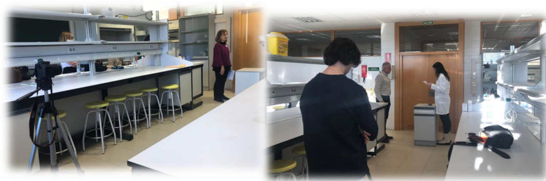
Figura 2. Imágenes de la grabación en directo de la realización de las ECOE

Se instalaron dos equipos de grabación en dos de las 5 estaciones para poder grabar en vídeo la realización de la prueba por diferentes estudiantes, como puede verse en la figura 2. Aprovechando el cambio de turno de estudiantes durante la realización de la prueba, se cambiaron secuencialmente los equipos de grabación al resto de estaciones para poder grabar las cinco estaciones.