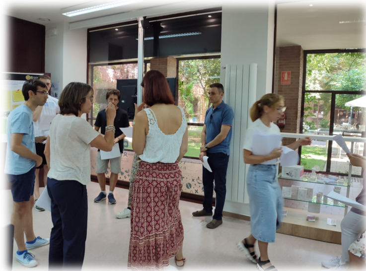
Figura 4. Imágenes de los ensayos en reuniones de preparación de nuevas estaciones para las pruebas ECOE