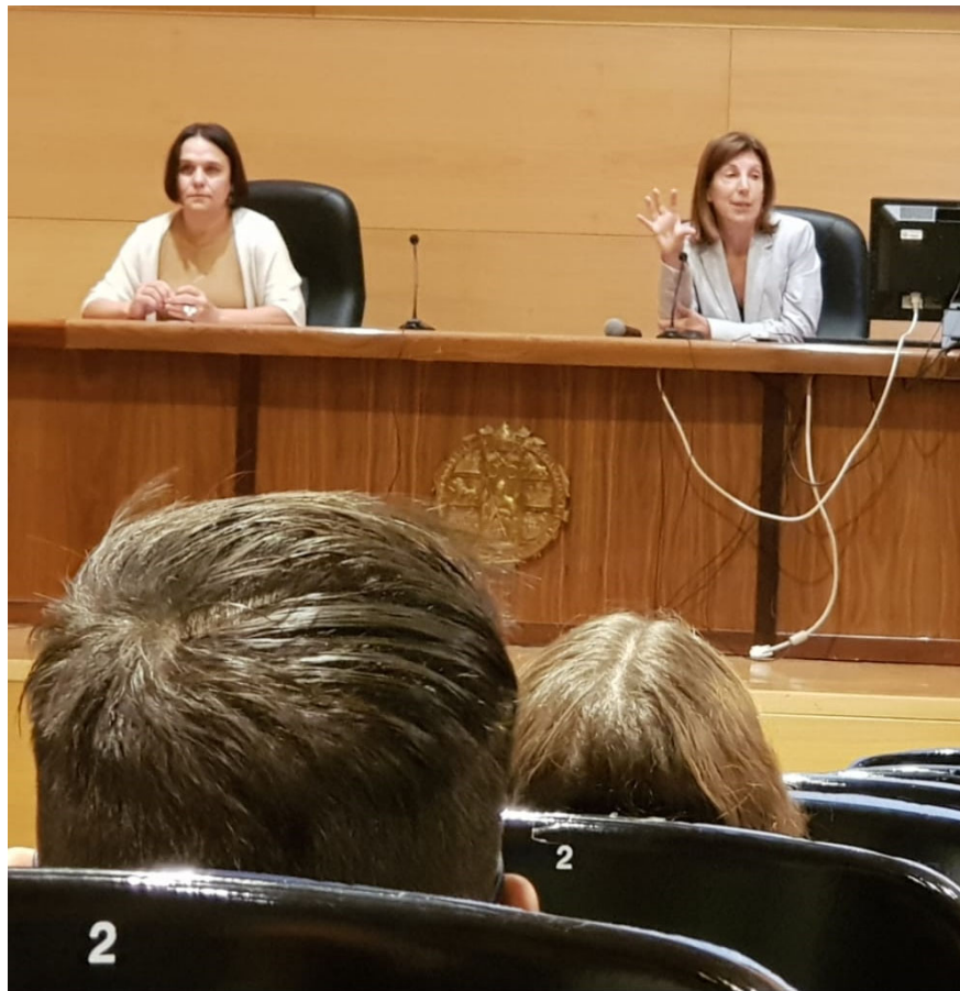
Fotografía Conferencia Agenda 2030 y ODS celebrada el 7 de Octubre de 2022 en el Salón de Actos Adolfo Suárez