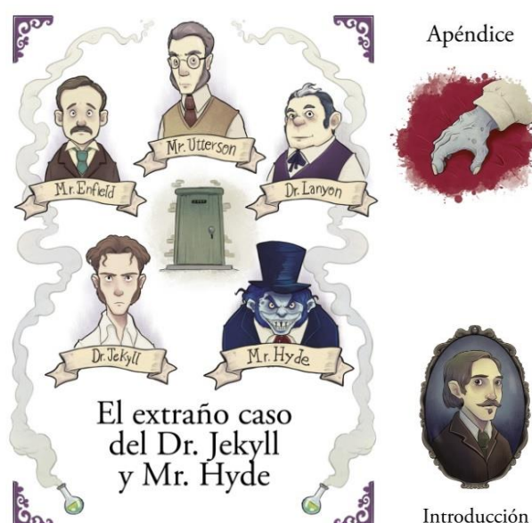
Ilustraciones de la versión infantil