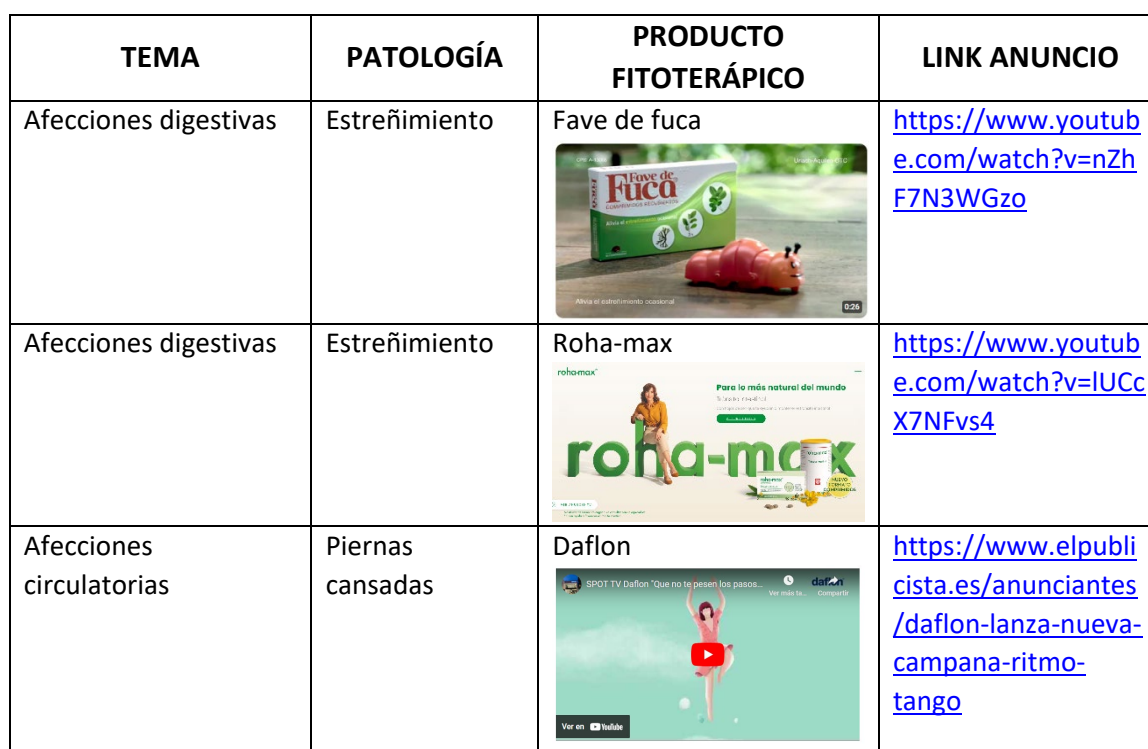
Tabla 1: Anuncios publicitarios de productos fitoterápicos.

En la primera fase , los profesores hemos seleccionado un total de 10 anuncios que se emiten en televisión relacionados con productos fitoterápicos. No nos ha sido posible encontrar de todos los temas, pero sí hemos conseguido visualizar anuncios de la mayoría del programa de la asignatura (6 de 8 temas) (Tabla 1).