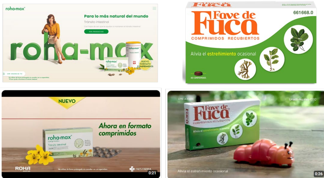
Figura 1. Anuncios publicitarios de productos para tratar el estreñimiento.

Una vez realizada esta visualización y debate previo, les hemos explicado más detalladamente la patología que vamos a estudiar en el tema, las medidas higiénico-dietéticas que son necesarias aplicar, las plantas medicinales útiles para tratar esa patología, etc. Y una vez finalizada la parte teórica, hemos vuelto a proyectar el mismo anuncio. En este punto abrimos un nuevo debate, y hemos observado que las opiniones de los alumnos suelen cambiar, porque ahora ya tienen unos nuevos conocimientos adquiridos, que hacen que valoren lo que transmiten los anuncios desde un punto de vista crítico.