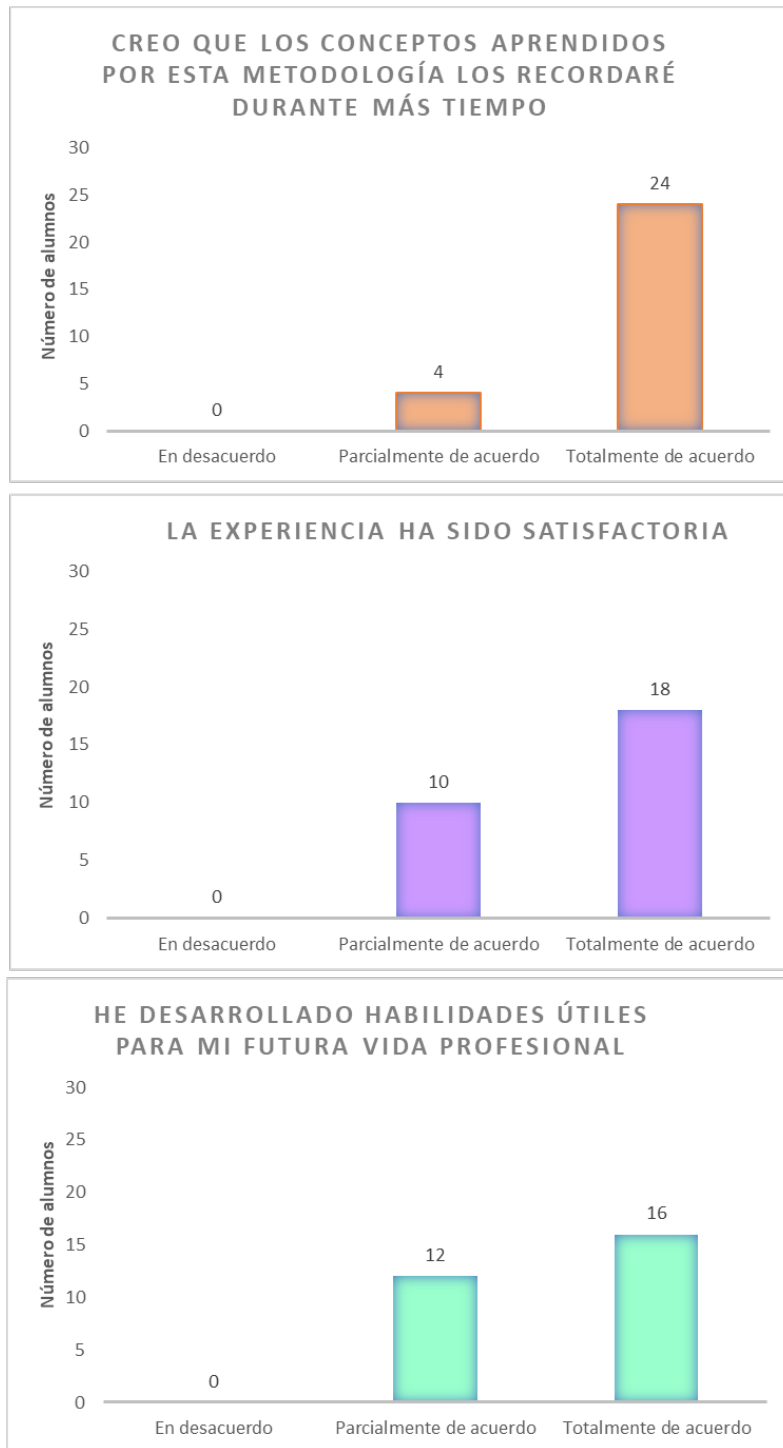
Figura 2. Resultados del grado de satisfacción por parte de los alumnos

Los estudiantes han comentado que la actividad les ha gustado, lo que se refleja también en la encuesta, donde la mayoría considera que ha sido una experiencia satisfactoria. También creen que han adquirido habilidades útiles para su futura vida profesional y nos sugieren que esta actividad se mantenga incluyendo más ejemplos que abarquen todos los temas.