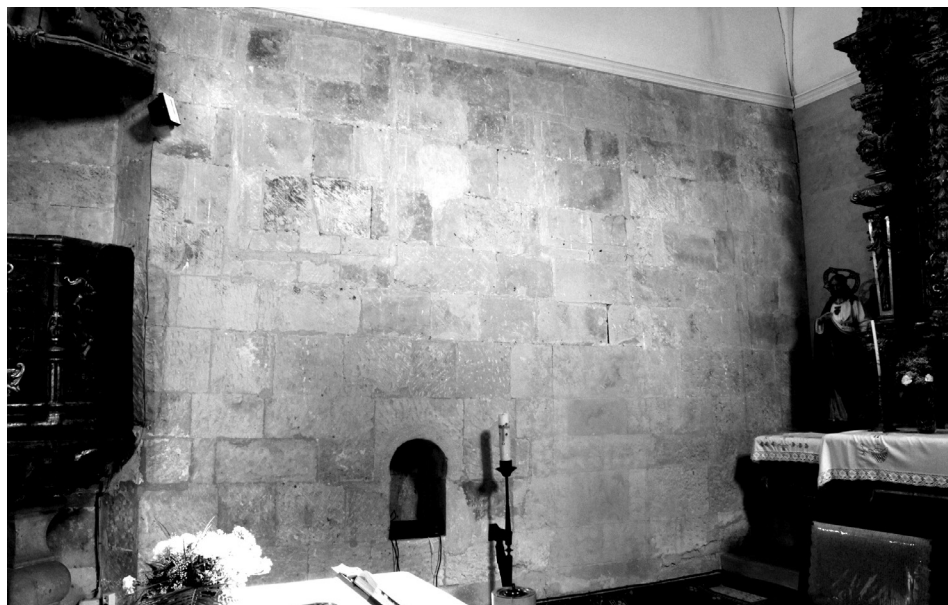
Figura 2: Muro septentrional de la cabecera.