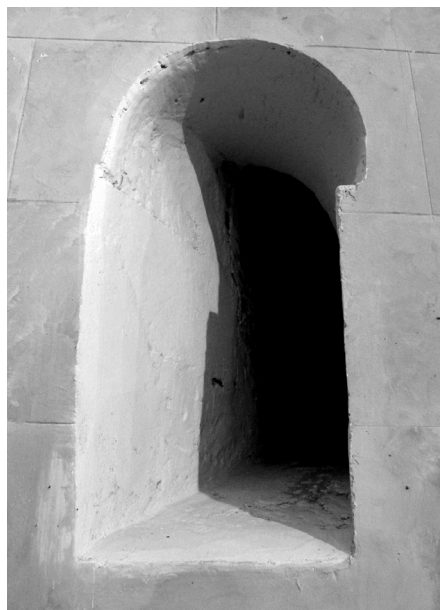
Figura 4: Vano transformado en el muro meridional de la cabecera.