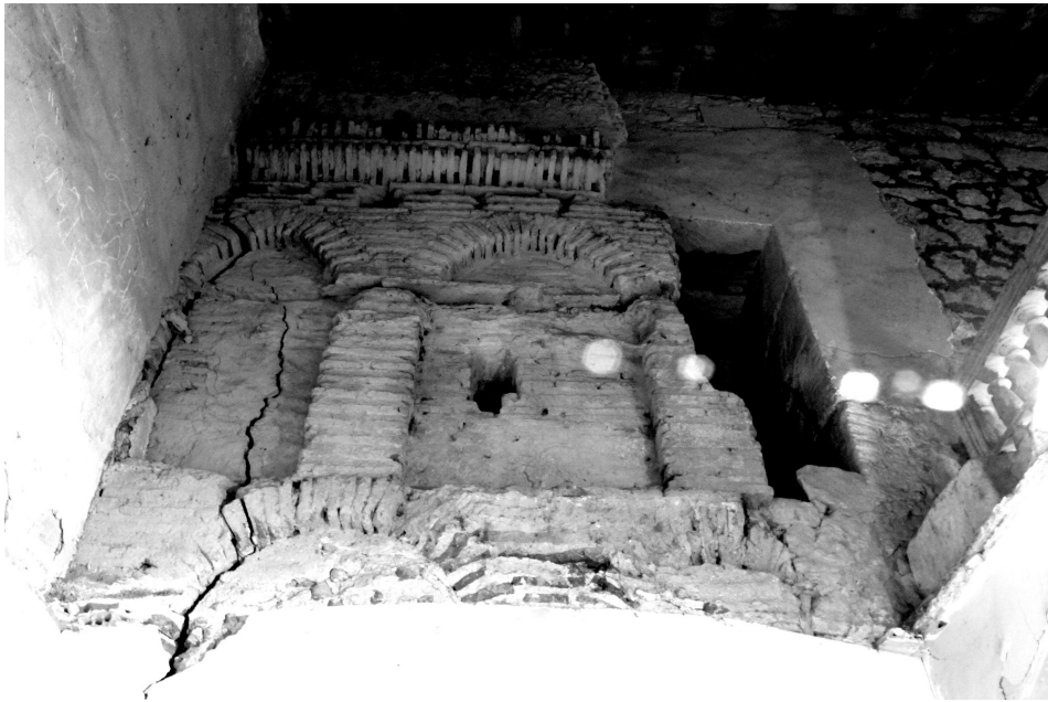
Figura 7: Restos de la fábrica mudéjar.