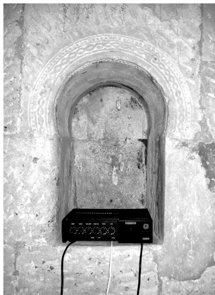
Figura 3: Oquedad de perfil ultrasemicircular en el muro norte de la cabecera.