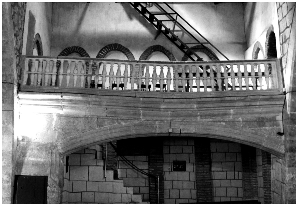
Figura 6: Arquería en ladrillo a los pies del templo.

numerosas transformaciones (figura 7). En el lienzo correspondiente a la nave de la epístola, sobre dos arcos de medio punto cegados y cubiertos casi por completo por enlucido, se levantan otros dos arcos de idéntico perfil también cegados; el del extremo derecho, ya visto por el interior, es de mayores proporciones. La arquería superior se presenta en distinto eje frente a la inferior, hecho que, dentro de su tosca factura, otorga un mayor dinamismo al paramento mural. Similar ordenación, aunque con diferencias, puede encontrarse en los ábsides de las iglesias mudéjares de Turra de Alba y de Peñarandilla (Salamanca), San Pedro en Alcazarén (Valladolid) y de manera más remota en San Miguel de Olmedo. El muro remata en doble perfil de nacela, conservándose el superior muy dañado. En el lienzo contrario, en la nave del evangelio, solo está libre de encalado la parte superior, muy parecida a la del otro extremo, y con similar acabado.