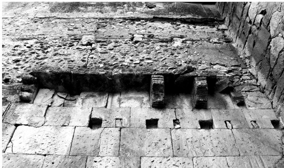
Figura 5: Muro septentrional de la cabecera al exterior.