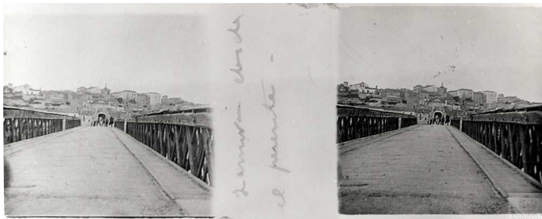
Fig. 1. «Zamora desde el puente» (CMU, 89/002).

El acceso a la vieja ciudad se realizaba desde el puente medieval, ofreciendo una singular vista de la ciudad antigua. Correspondiente a 1864, en «Zamora desde el puente» (CMU, 89/002) se observa recortada la silueta de la urbe desde el puente de Piedra, siendo este uno de los principales protagonistas (fig. 1). Por medio de dos líneas convergentes, constituidas por la barrera del puente, que se contraponen a la irregular línea horizontal, la atención focal se centra en la torre del extremo. Compuesta por un arco de medio punto, que remataba en un frontón triangular tal y como se observa en la imagen, estructura que fue eliminada entre 1905 y 1907 por el ingeniero Luis de Justo dentro de un proceso de restauración general del puente con el fin de devolverlo a su estado primitivo 20 . Por la parte superior la iglesia románica de San Cipriano y a la derecha el actual Parador, antiguo palacio de los Condes de Alba y Aliste, construcción de gran empaque. Las sencillas viviendas, apiñadas entre sí, presentaban una altura muy limitada y la mayoría han sido reedificadas hace ya varios años. A pesar de las notables diferencias, la conocida litografía de Parcerisa de este mismo espacio, coincide en lo que al horizonte de la ciudad al fondo, incluso con la presencia del humo de la chimenea, y los tipos populares recorriendo la obra civil 21 .