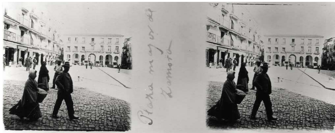
Fig. 3. «Plaza mayor de Zamora» (CMU, 89/012).

eliminan, bajo unos criterios cuanto menos dudosos, todas las viviendas adosadas a la iglesia de San Juan de Puerta Nueva con el fin de liberar el entorno.