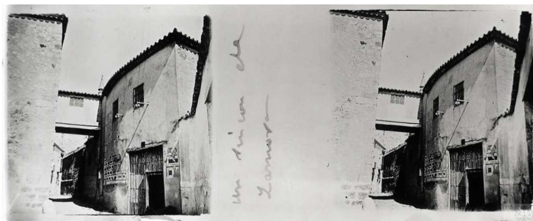
Fig. 5. «Un rincón de Zamora» (CMU, 89/007).

«Un rincón de Zamora» (CMU, 89/007) supone una rareza en cuanto que espacio marginal, que en limitadas ocasiones se fotografía durante este período, pero de gran placer estético por la presencia del paso elevado que comunicaba los dos edificios en la calle del Arcipreste desde la plaza de los Ciento (fig. 5). Nos encontramos ante la representación de la Casita de Nazaret cuyo pasadizo permitía la comunicación directa con la Capilla de los Ciento, dispuesta a la izquierda, preservando de este modo la clausura como bien ha señalado García Lozano 42 . La celosía, «para que las personas que están en el interior vean sin ser vistas» según definición de la R.A.E., refleja sus usos y así «La Casita de Nazaret les sirve de convento, mientras que la capilla de los Ciento será su lugar de culto ordinario» 43 .