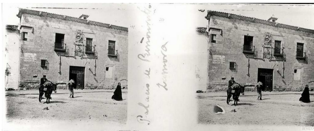
Fig. 4. «Palacio de Puñonrostro, Zamora» (CMU, 89/014).

En esta escena de calle, en la que el conjunto monumental sirve como telón de fondo a la inversa de lo que se había advertido para la Catedral y el entorno, los tipos humanos alcanzan gran repercusión. Los soportales, el adoquinado, los arquetipos populares, el carácter pintoresco... «Y todos estos trajes, todas estas prendas, amén de multitud de objetos y enseres de formas curiosas, van perdiéndose sin que se recojan en un museo etnográfico nacional» 34 . Con una gran clarividencia el propio Unamuno adelantaba la necesidad de crear un Museo Etnográfico. A pesar del siglo que casi transcurre desde su observación, su anhelo se ha visto cumplido puesto que en el año 2002 se inauguró en la propia Zamora el Museo Etnográfico de Castilla y León 35 .