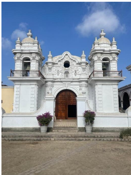
Figura 4. La Hacienda San José del Carmen.

Fuente : elaboración propia (agosto de 2024).