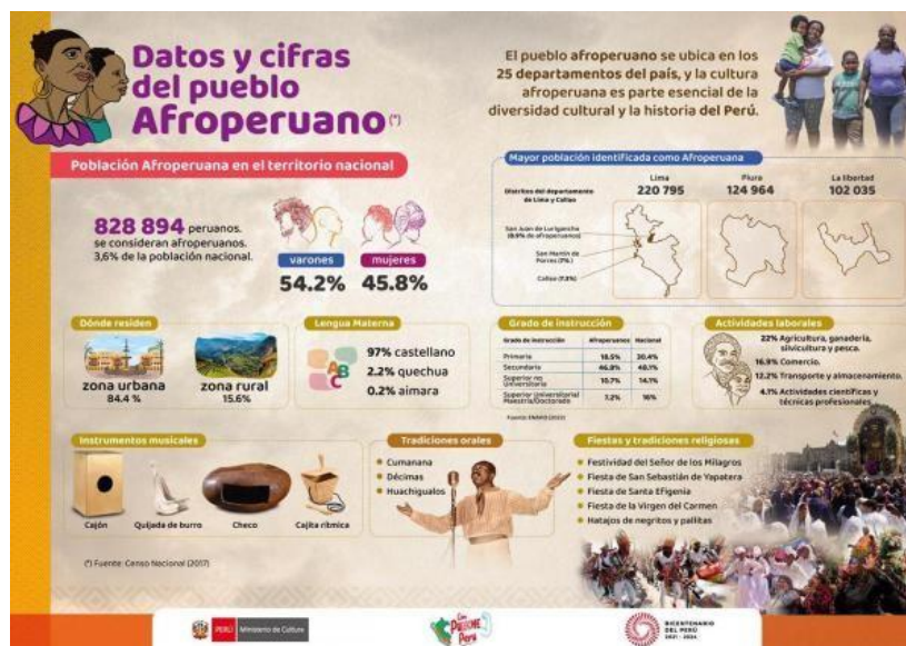
Figura 1. Datos, cifras y elementos culturales destacados del pueblo afroperuano