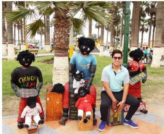
Figura 7. Muñecos de paja.