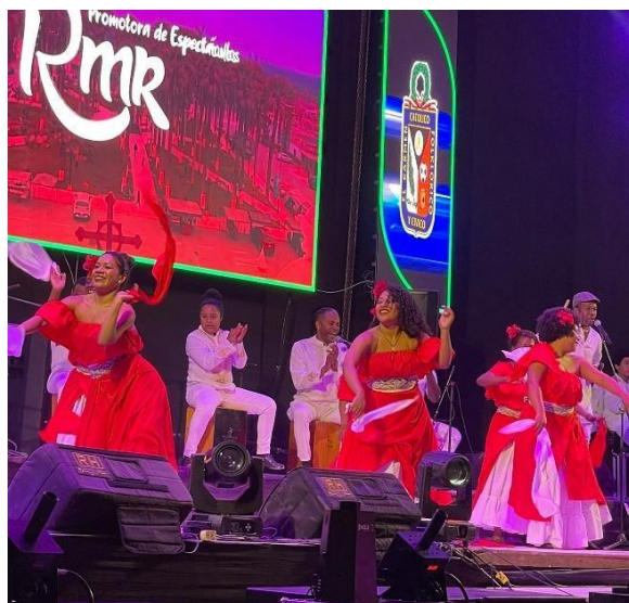
Figura 3. La familia Ballumbrosio y sus grupos de danza y de música, dando un espectáculo para el aniversario del Carmen (agosto de 2024).