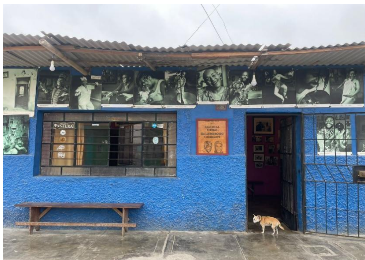
Figura 9. Casa de la Ballumbrosio Guadalupe, en El Carmen. Frente a la casa.