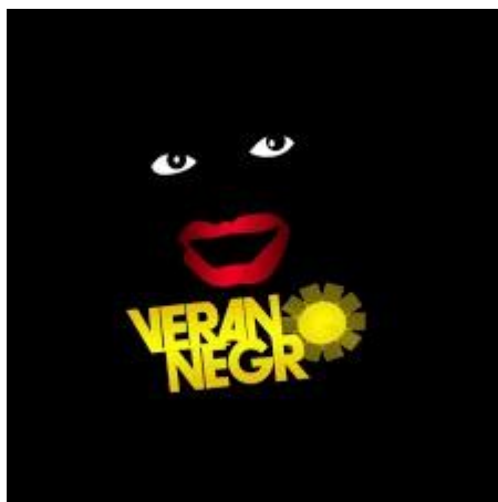
Figura 6. Logo del Verano Negro.