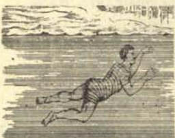
3. Salida a flote.