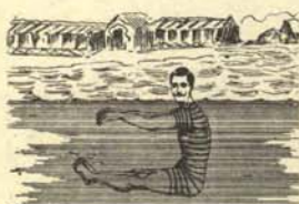
5. Vigilancia de la ropa o empleo que se teme perder.