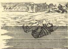
4. Primera toma de posición.